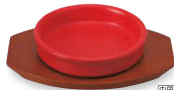
585-304-632 1,700円 B 11cmアヒージョ皿RD(11.2×3) 859950563