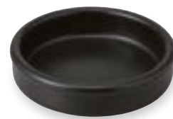
585-106-602 1,850円 E 耐熱黒15cmバル (15×3.1) 949310160