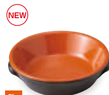
陶 585-506-632 3,000円 C イタリア製