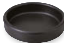
585-105-602 1,750円 E 耐熱黒14cmバル (14×2.9) 949310260