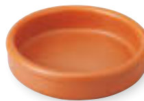
585-205-082 1,750円 E レンガ14cmバル (14×2.9) 949320208