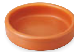
585-206-082 1,850円 E レンガ15cmバル (15×3.1) 949320108