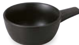
585-403-602 2,100円 B 耐熱黒 片手ラメキン (15×10×5.1) 949240260