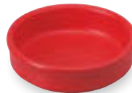
585-303-632 1,300円 A 9cmアヒージョ皿RD(9×2.7) 859950663