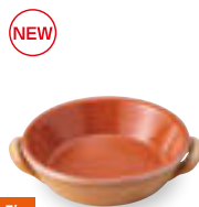
陶 585-501-632 2,600円 B イタリア製