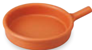
585-301-032 1,760円 C フライパン(17.5×13×2.7) 949210103