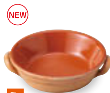
陶 585-502-632 3,000円 C イタリア製