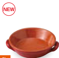
陶 585-503-632 2,900円 B イタリア製