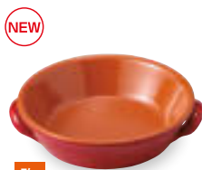
陶 585-504-632 3,200円 C イタリア製