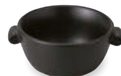
585-404-602 1,650円 B 耐熱黒 両手ラメキン (12.7×10.7×5.1) 949240160