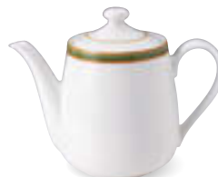
535-65-612 7,150円 ポット (11 × 14.5・750cc) 754406561