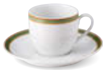
535-60-612 2,400円 コーヒー C/S (7.5 × 6.5) 754405961