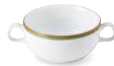
535-55-612 2,500円 プリオン (11 × 5・300cc) 754406461