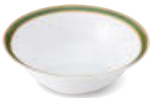
535-56-612 1,300円 6 1/2 吋オートミル (16.6 × 4.8) 754405561