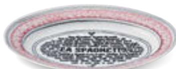
535-14-032 5,850円 ピンクリムプラター (32 × 22.8 × 4.3) 651301403