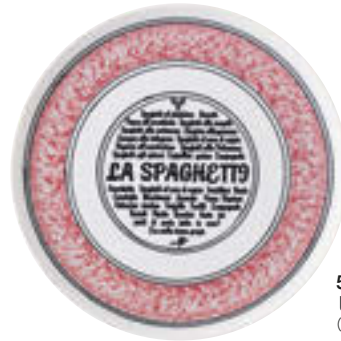
535-15-032 8,400円 ピンクピザプレート (31.8 × 1.4) 651301603