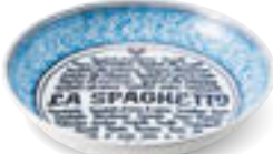
535-8-032 2,370円 ブルーパスタボール (24 × 4.8) 651300803