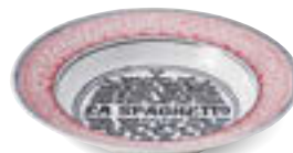
535-10-032 3,080円 ピンクリムスープ (26.4 × 4.9) 651301003