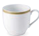
535-64-612 1,650円 マグ (8.2 × 7.6・210cc) 754406361