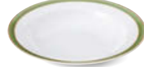
535-59-612 1,900円 9 吋スープ (23 × 4) 754405861