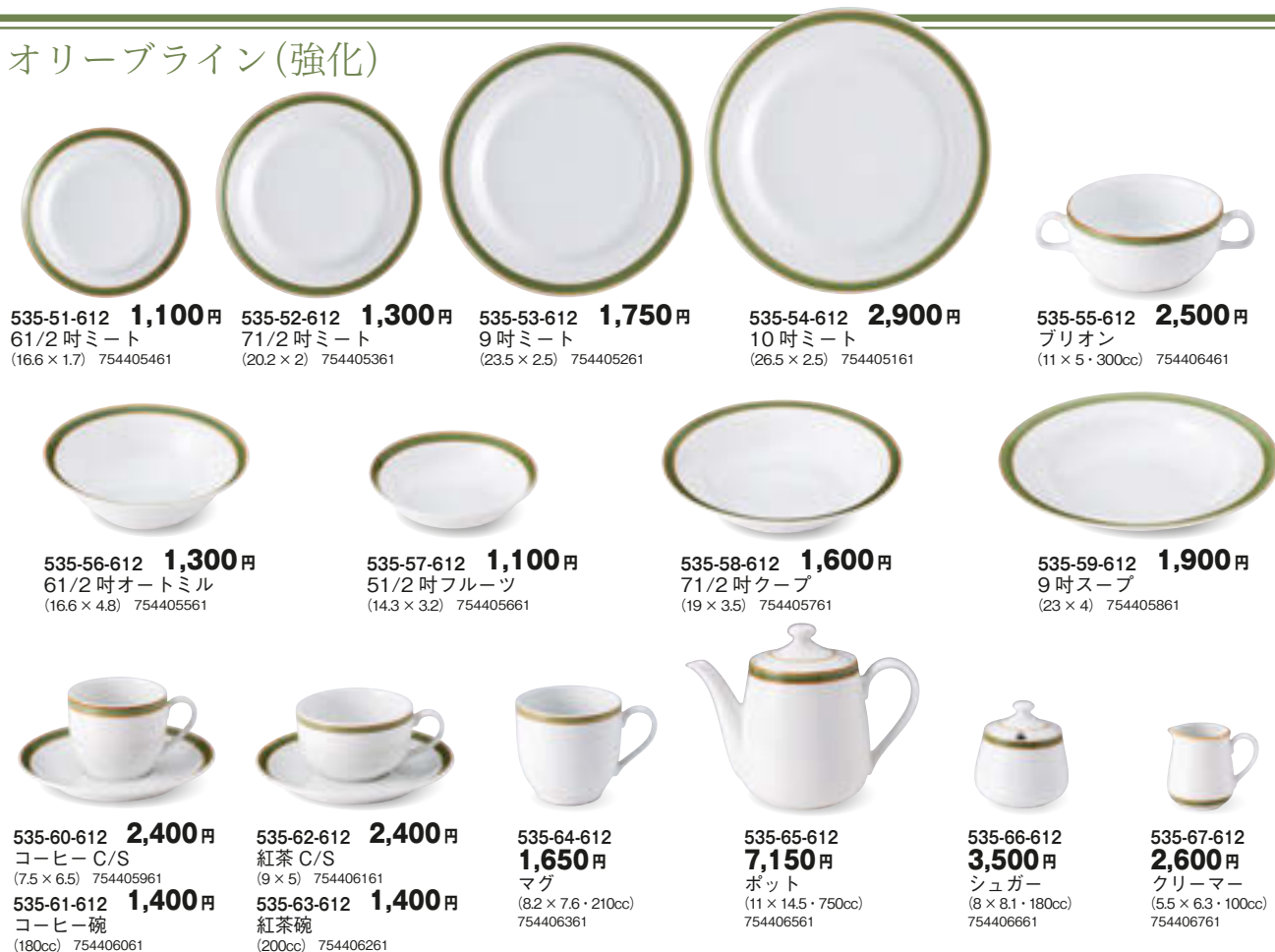
535-51-612 1,100円 6 1/2 吋ミート (16.6 × 1.7) 754405461