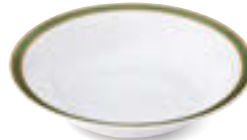
535-58-612 1,600円 7 1/2 吋クーブ (19 × 3.5) 754405761