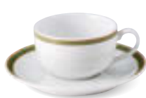
535-62-612 2,400円 紅茶 C/S (9 × 5) 754406161