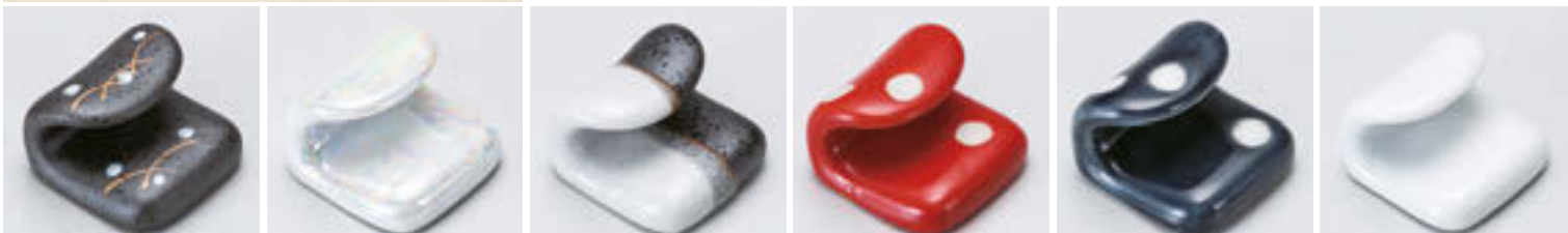
412-401-782 820円 金彩武蔵野巻紙箸置 (4×3.8×2.5) 1141640478 412-402-782 800円 ラスター巻紙箸置 (4×3.8×2.5) 1141640178 412-403-742 640円 塗分箸置 (4×3.8×2.5) 539570977 412-404-702 580円 水玉(紅)巻紙箸置 (4×3.8×2.5) 1141640270 412-405-702 580円 水玉(紺)巻紙箸置 (4×3.8×2.5) 1141640370 412-406-742 540円 白磁巻紙箸置 (4×3.8×2.5) 1141640674