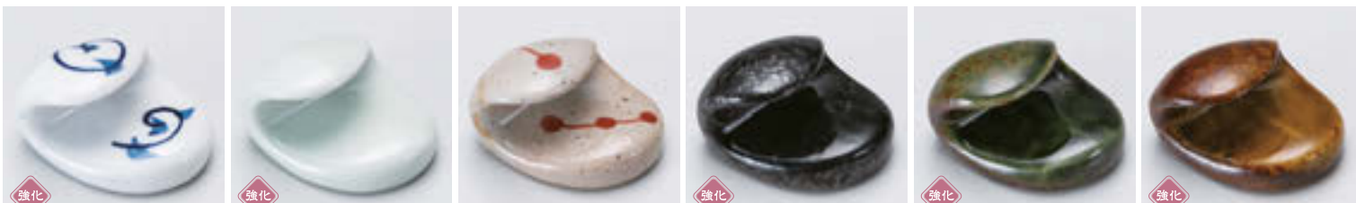
412-601-742 780円 染付唐草まゆ箸置 (4.2×3.3×2.6) 539570774 412-602-742 700円 葱青磁まゆ箸置 (4.3×3.3×2.6) 1141650374 412-603-742 700円 水玉つなぎまゆ箸置 (4.4×3.3×2.6) 1141650474 412-604-702 640円 雲海まゆ型箸置 (4.4×3.3×2.6) 1141650570 412-605-702 640円 南蛮織部まゆ型箸置 (4.4×3.3×2.6) 1141650170 412-606-702 640円 南蛮黄瀬戸まゆ型箸置 (4.4×3.3×2.6) 1141650270