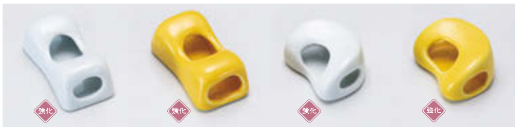
412-101-742 940円 青白磁旅枕箸置 (5.5×2.7×2.1) 539560277 412-102-782 940円 黄輝箸置 (5.5×2.7×2.1) 539560377 412-103-782 940円 青白磁勾玉型箸置 (4×3.5×2) 539570578 412-104-782 940円 黄輝勾玉型箸置 (4×3.5×2) 539570678