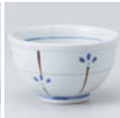
397-305-742 700円 芽生え千茶(青) (8.9×5.2・180cc) 537920374