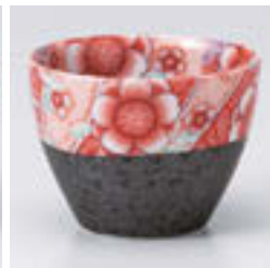
397-106-162 1,320円 紅華小千茶 (7×5.2・120cc) 1140110316