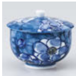
397-101-792 1,450円 ダミ槍柄蓋付千茶 (8.3×7.5・165cc) 1040710179