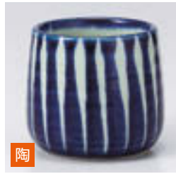
陶 397-201-752 1,300円 藍十草小湯呑 (6×6・120cc) 1140140375