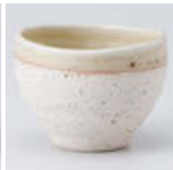
397-504-262 390円 ロクロ目ヒワ丸煎茶 (7.8×5.7・150cc) 837670426