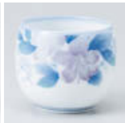
397-503-262 500円 白磁花の香玉湯呑 (7.5×6.175cc) 940570526