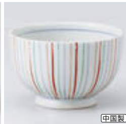
397-304-512 600円 染錦京十草高浜煎茶 (8.8×5.5・220cc) 537920151