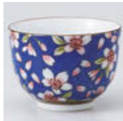
397-301-542 900円 桜浪漫(青)千茶 (8×5.7・160cc) 940320354