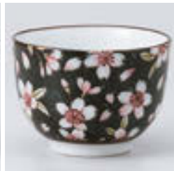
397-302-542 900円 桜浪漫(黒)千茶 (8×5.7・160cc) 940320154