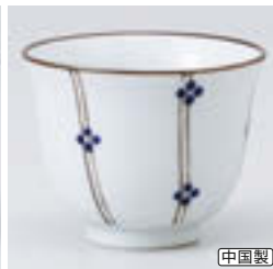
中国製 397-502-522 420円 十草丸紋青煎茶 (φ8×6.6・160cc) 1040750452