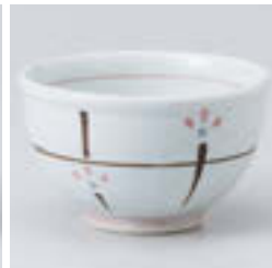
397-306-742 700円 芽生え千茶(赤) (8.9×5.2・180cc) 537920274