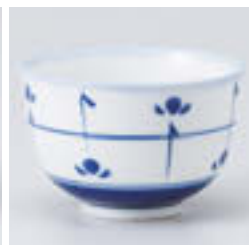
397-405-572 470円 新芽反千茶 (8.5×5.5・150cc) 537970257