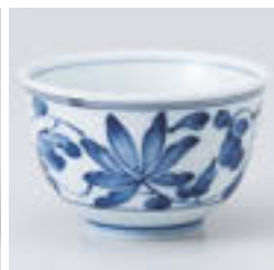
397-403-572 490円 唐草小千茶 (7.7×4.8・120cc) 537970157