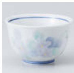
397-402-572 550円 白磁スミレ小千茶 (7.7×4.8・120cc) 537950557