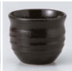
397-505-572 380円 ゆず黒小湯呑 (6.8×5.8・120cc) 940370357