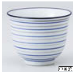
中国製 397-501-522 420円 トレイン煎茶 (φ8×6.6・160cc) 1040750352