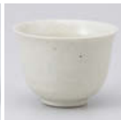
397-606-562 220円 粉引堀煎茶 (8.4×6・140cc) 1140370656

刺身 向付 中鉢 小鉢 小付 珍味 松花堂 前菜皿 付出皿 焼物皿 天皿 呑水 蓋物 蒸碗 土瓶蒸し 小皿 和皿 多用皿 多用鉢 盛込鉢 盛込皿 酒器 フリー カップ そば用品 薬味皿 めん皿 井 多用井 波佐見焼 特選 茶漬碗 飯碗 土瓶 ポット 急須 湯呑 千茶 カスター 卓上小物 箸置 レンジ スプーン 灰皿