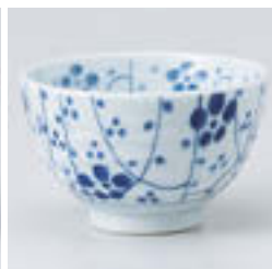
397-602-402 330円 光林梅千茶 (9.2×5.7・160cc) 940550140