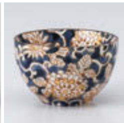
397-104-512 1,400円 色唐草(紺)デミ千茶 (7.7×4.8・150cc) 1040710551