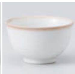
397-604-262 400円 粉引き煎茶 (9×5.4・160cc) 837670526