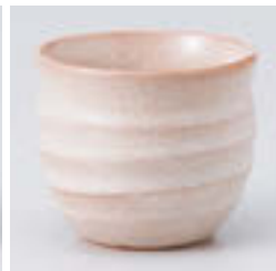
397-506-572 380円 ゆず志野小湯呑 (6.8×5.8・120cc) 940370457