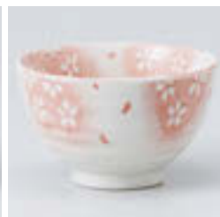
397-605-402 330円 花晴千茶 (9.2×5.7・160cc) 837950640