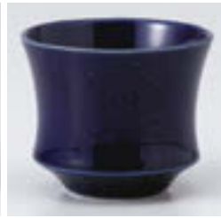
397-203-522 1,160円 夜空千茶 (8×6.7・160cc) 1040740252