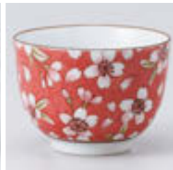
397-303-542 900円 桜浪漫(赤)千茶 (8×5.7・160cc) 940320254