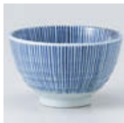
397-601-352 380円 泉岳十草千茶 (9×5.6・160cc) 538150535