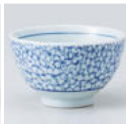
397-603-402 330円 花ちらし千茶 (9.2×5.7・160cc) 538150640