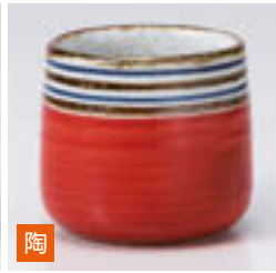
陶 397-202-752 1,300円 千筋赤巻小湯呑 (6×6・120cc) 1140140275