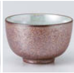
397-205-152 1,250円 カハラレッドシルバ煎茶 (9×5.5・180cc) 940310215