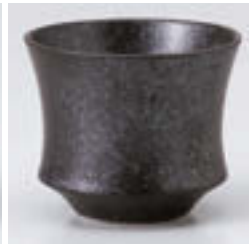
397-204-522 1,100円 銀黒千茶 (8×6.7・160cc) 1040740152