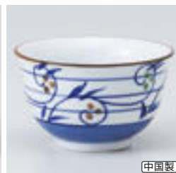
397-406-522 420円 つる木の実煎茶 (φ8.6×5.2・140cc) 1040750552