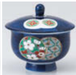
397-102-792 720円 ダミ丸紋蓋付千茶 (9.5×9・165cc) 1040710279