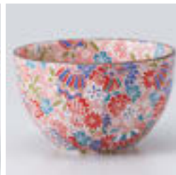
397-103-152 1,900円 京雅(赤)煎茶 (9.5×5.8・240cc) 940310115