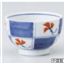
397-404-512 420円 染錦市松小花高浜千茶 (8.8×5.5・220cc) 1040730251