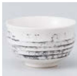
397-401-572 640円 クリーム黒ハケメケズリ千茶 (8.4×5.3・150cc) 940240457