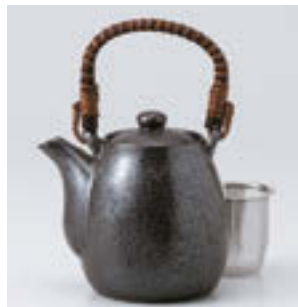
369-501-352 3,350円 黒結晶土瓶(カゴアミ付) (9×12×400cc) 835150135