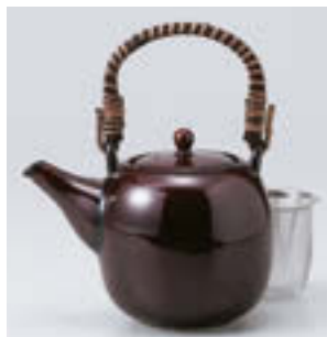
369-304-522 5,100円 うるし釉土瓶Uアミ付 (10.5×11.5×520cc) 534710152