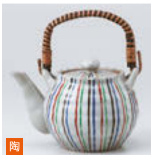
陶 369-103-512 4,700円 十草6号土瓶 (19×12.5×1000cc) 534530251