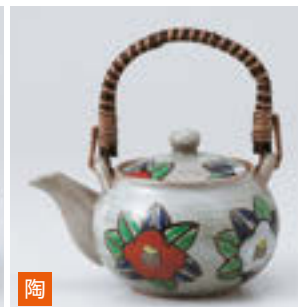
陶 369-205-512 3,000円 染錦椿(中)土瓶 (16.5×10.5×600cc) 937530351