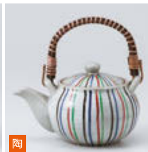
陶 369-105-512 3,000円 十草中土瓶 (16.5×10.5×600cc) 534530351