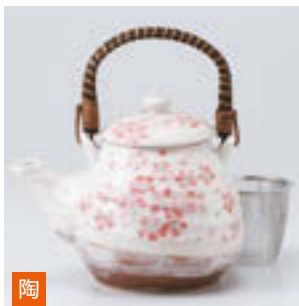
陶 369-303-522 4,200円 平安桜土瓶Uアミ付 (11.5×14×770cc) 534610552