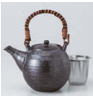
369-403-522 4,400円 銀黒土瓶(アミ付)大 (16×10.3×11.3×530cc) 1037940452