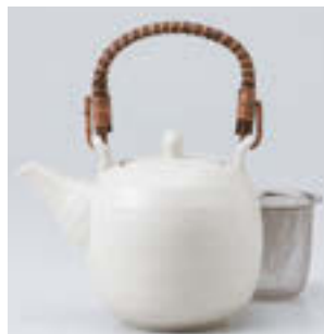
369-401-152 4,500円 粉引丸土瓶(カゴアミ付) (14.3×9.8×11.5×520cc) 534730515