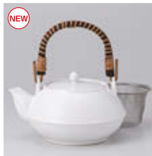
NEW 369-201-252 5,650円 あられ土瓶 白 (17.1×14.7×9.5×800cc) 1236920125