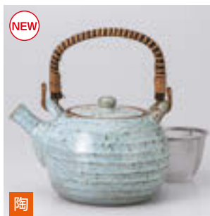
NEW 陶 369-102-542 8,000円 唐津7号土瓶 (15×11.8×1250cc) 1236910254