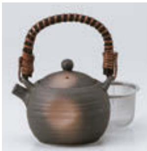
369-503-512 2,900円 黒伊賀吹玉土瓶(カゴアミ付) (10.5×9×280cc) 534650451