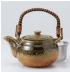
369-203-012 3,980円 グリーン伊良保5号土瓶(U・茶コシ付) (19×12×750cc) 835120201