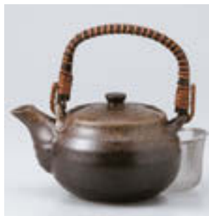
369-204-012 3,980円 金彩5号土瓶(U・茶コシ付) (19×12×750cc) 835120101