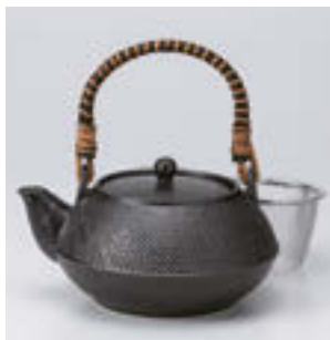
369-202-252 5,650円 あられ土瓶 鉄黒 (17.1×14.7×9.5×800cc) 1137320125