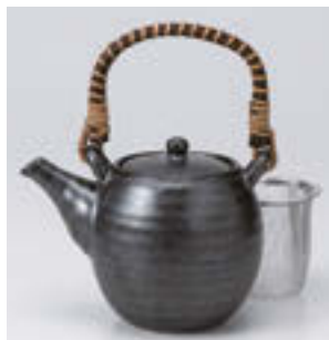
369-404-522 4,400円 漆黒土瓶(小) (13.5×9.4×10.1×350cc) 1137350452