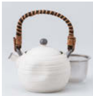
369-504-512 2,900円 粉引玉土瓶(カゴアミ付) (10.5×9×280cc) 534650251