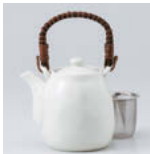
369-502-352 3,350円 セミマット土瓶(カゴアミ付) (9×12×400cc) 835150235