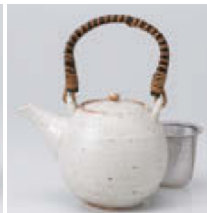
369-405-602 4,050円 サビ志野土瓶(大)(16×10.3×11.3×530cc) 1137340560 369-406-602 4,000円 サビ志野土瓶(小)(13.5×9.4×10.1×370cc) 1137340660