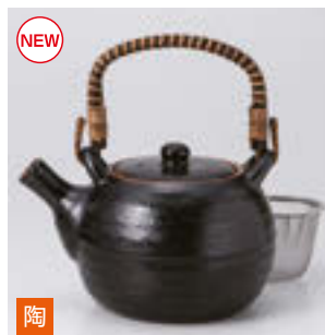
NEW 陶 369-101-542 8,000円 ゆず天目7号土瓶 (15×11.8×1250cc) 1236910154