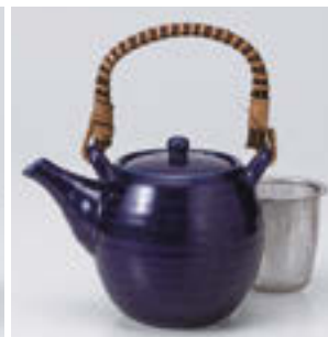
369-305-522 4,500円 夜空土瓶(アミ付)大(16×10.3×11.3×530cc) 1037940352 369-306-522 4,400円 夜空土瓶(小)(13.5×9.4×10.1×350cc) 1137350652