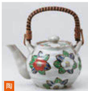
陶 369-104-512 4,700円 染錦椿6号土瓶 (19×12.5×1000cc) 937510451