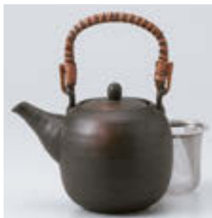
369-402-152 4,500円 備前丸土瓶(カゴアミ付) (14.3×9.8×11.5×520cc) 534720515