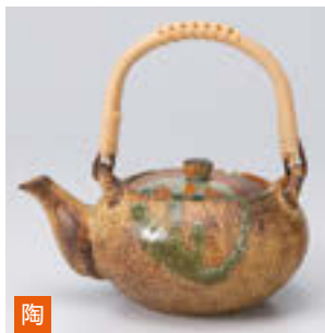
陶 369-302-752 2,000円 織部流し土瓶 (11×7.5×400cc) 1137350375