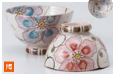
陶 352-101-792 1,850円 花つなぎ 紫飯碗(大) (10.8×7) 633210346 352-102-792 1,850円 花つなぎ ピンク飯碗(小) (10×6) 633210446