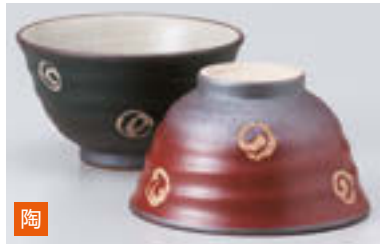
陶 352-201-472 1,500円 吹丸茶碗(緑) (11.8×6.7) 532860147 352-202-472 1,500円 吹丸茶碗(赤) (11.8×6.7) 532860247