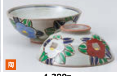
陶 352-405-512 1,300円 錦椿茶碗大(青) (12.5×5.2) 533320851 352-406-512 1,300円 錦椿茶碗小(赤) (12×4.8) 533320751