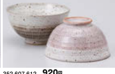
陶 352-607-612 920円 掻き落し茶碗 グレー(11.4×6.2) 1135650361 352-608-612 920円 掻き落し茶碗 ピンク(11×6) 1135650461