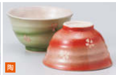
陶 352-107-472 1,550円 春うらら茶碗(グリーン) (12×6.8) 532860547 352-108-472 1,550円 春うらら茶碗(ピンク) (12×6.8) 532860647