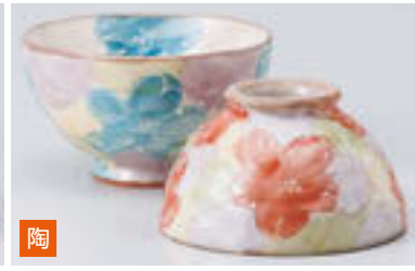
陶 352-205-702 1,500円 彩り優花大平(11.5×6.5) 633220370 352-206-702 1,400円 彩り優花中平(10.6×6) 633220470