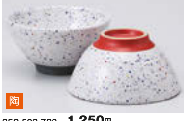
陶 352-503-782 1,250円 5色ドット飯碗 青(φ11.6×5.7) 1135610778 352-504-782 1,250円 5色ドット飯碗 赤(φ11.6×5.7) 1135610878