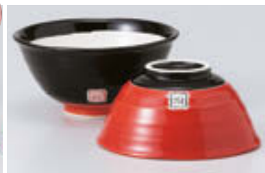
陶 352-105-472 1,800円 黒雅大平(12.5×6) 533230447 352-106-472 1,800円 赤雅中平(11.5×5.5) 533230347