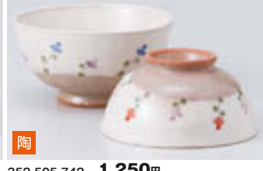
陶 352-505-742 1,250円 初恋草飯碗(大) (青) (12.2×6.5) 533310774 352-506-742 1,150円 初恋草飯碗(小) (赤) (11.2×5.7) 533310874