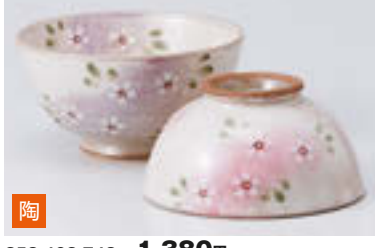
陶 352-403-742 1,380円 花かすみ大平(12.2×6.2) 533310177 352-404-742 1,280円 花かすみ中平(11.5×5.5) 533310277