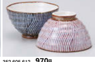
陶 352-605-612 970円 まがり十草茶碗 青(11.5×6.7) 1135660561 352-606-612 970円 まがり十草茶碗 赤(11.5×6.7) 1135660661