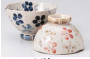
陶 352-303-742 1,450円 藍香大平(10.8×6.7) 1235230374 352-304-742 1,350円 藍香中平(10×5.7) 1235230474