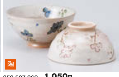
陶 352-507-262 1,050円 木の花 青大平(12×5.8) 833720726 352-508-262 1,000円 木の花 赤中平(11.5×5.5) 833720826