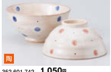
陶 352-601-742 1,050円 くるくる大平(青) (11.9×5.8) 533340374 352-602-742 950円 くるくる中平(赤) (11.4×5.4) 533340474