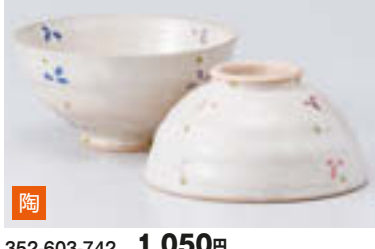
陶 352-603-742 1,050円 一珍立花大平(11.9×5.8) 633340974 352-604-742 950円 一珍立花中平(11.4×5.4) 633341074