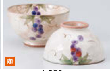
陶 352-307-702 1,320円 二色ぶどう大平(11.5×6.5) 633220170 352-308-702 1,220円 二色ぶどう中平(10.6×6) 633220270