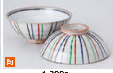
陶 352-407-512 1,300円 錦色入十草大平(12.5×5.2) 532940651 352-408-512 1,300円 錦色入十草中平(12×4.8) 532940551