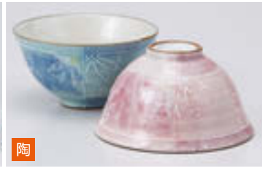
陶 352-207-752 1,700円 花格子飯碗 ブルー(12×6.5) 1135640175 352-208-752 1,700円 花格子飯碗 ピンク(12×6.5) 1135640275