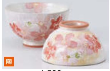
陶 352-301-742 1,500円 春うらら大平(11.1×6.5) 732020574 352-302-742 1,400円 春うらら中平(10.4×6) 732020674