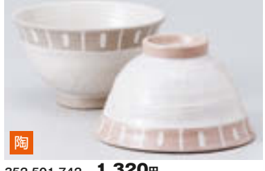
陶 352-501-742 1,320円 測飾り反茶碗(グレー) (11.2×6.5) 833710774 352-502-742 1,320円 測飾り反茶碗(ピンク) (11.2×6.5) 833710874