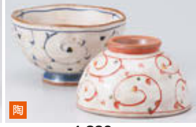
陶 352-305-742 1,380円 粉引唐草大平(青) (11.1×6.5) 533250174 352-306-742 1,280円 粉引唐草中平(赤) (10.4×6) 533250274