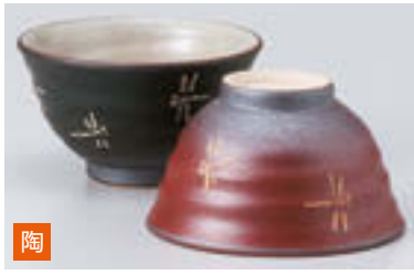
陶 352-203-472 1,500円 トンボ茶碗(緑) (12×6.7) 532860347 352-204-472 1,500円 トンボ茶碗(赤) (12×6.7) 532860447