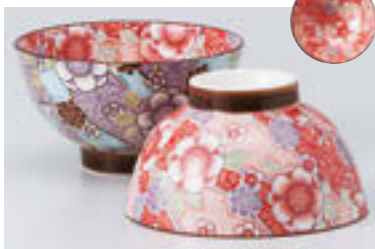
陶 352-103-512 2,160円 紅染茶碗(外青) (11.1×5.8) 732010651 352-104-512 2,160円 紅染茶碗(外赤) (11.1×5.8) 732010551