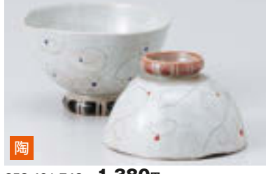
陶 352-401-742 1,380円 春風大平(青) (11×6.8) 533250374 352-402-742 1,380円 春風中平(赤) (10×6.8) 533250474