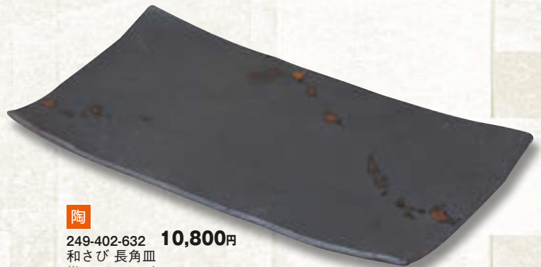
陶 249-402-632 10,800円 和さび 長角皿 (約33.5×18.4×2.2) 925610363