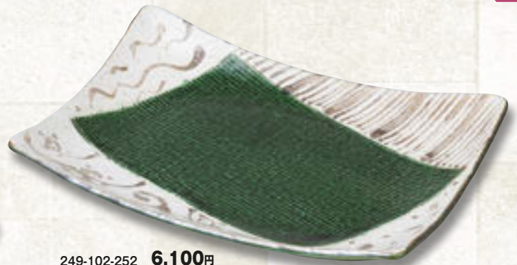
249-102-252 6,100円 織部トチリ大盛皿 (33×23.5×5) 623940325