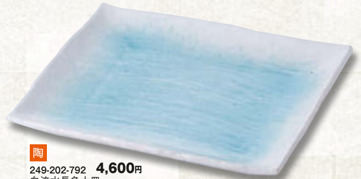
陶 249-202-792 4,600円 白流水長角大皿 (30×26.3×4.2) 524910277