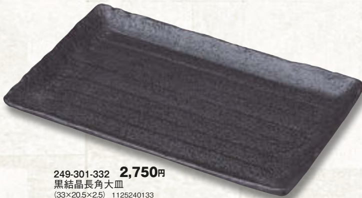
249-301-332 2,750円 黒結晶長角大皿 (33×20.5×2.5) 1125240133