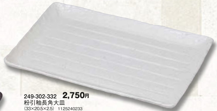
249-302-332 2,750円 粉引釉長角大皿 (33×20.5×2.5) 1125240233