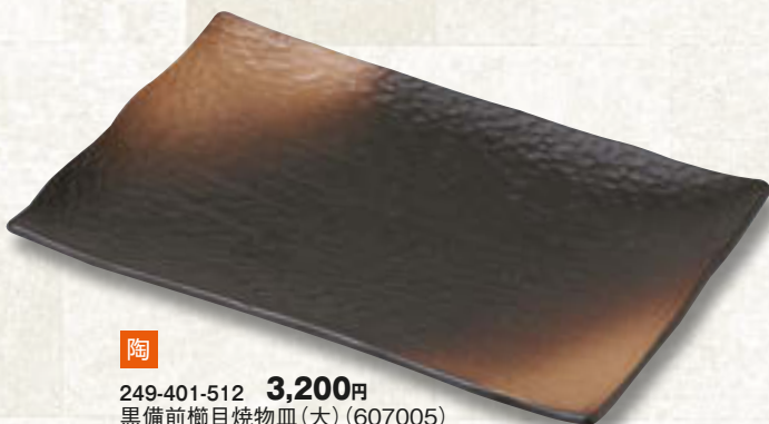
陶 249-401-512 3,200円 黒備前櫛目焼物皿(大) (607005) (30×21.5×3.5) 925710151