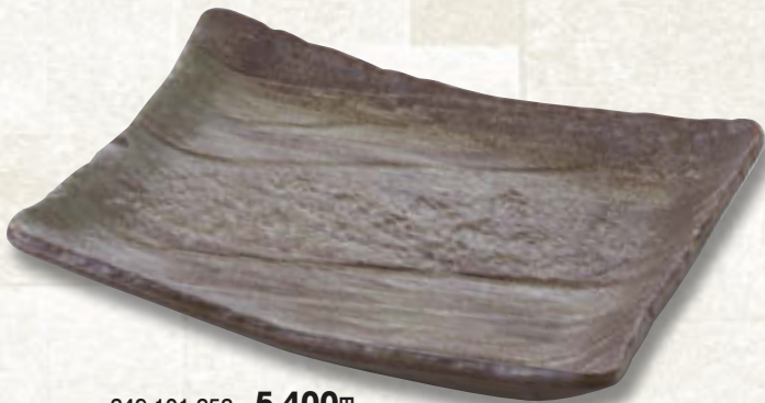
249-101-252 5,400円 越前角大皿 (30.5×24.5×5) 524640325