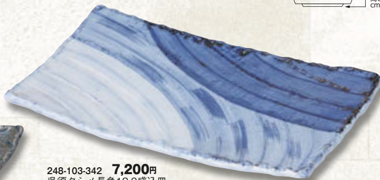
248-103-342 7,200円 呉須クシメ長角12.0盛込皿 (37×21×4.5) 524230134