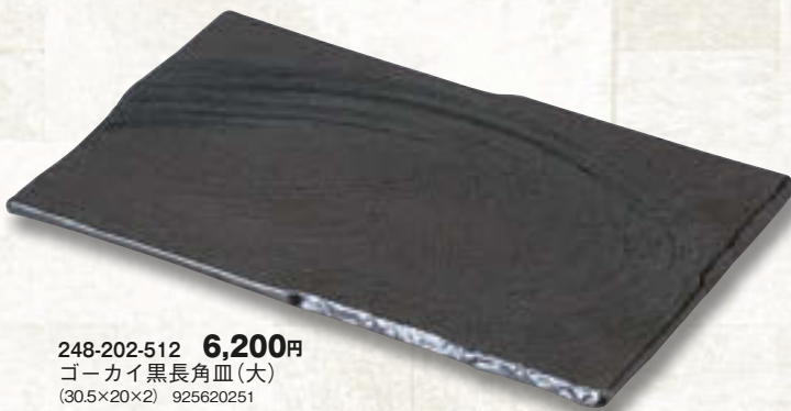
248-202-512 6,200円 ゴークイ黒長角皿(大) (30.5×20×2) 925620251