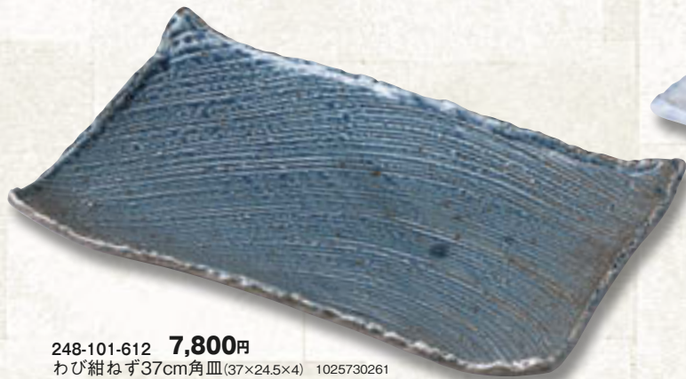
248-101-612 7,800円 わび紺ねず37cm角皿(37×24.5×4) 1025730261 248-102-612 6,100円 わび紺ねず31cm角皿(31×21×4) 1026220361

刺身 向付 中鉢 小鉢 小付 珍味 松花堂 前菜皿 付出皿 焼物皿 天皿 香水 蓋物 蒸碗 土瓶蒸し 小皿 和皿 多用皿 多用鉢 盛込鉢 盛込皿 酒器 フリー カップ そば用品 薬味皿 めん皿 井 多用井 波佐見焼 特選 茶漬碗 飯碗 土瓶 ポット 急須 湯呑 千茶 カスター 卓上小物 箸置 レンゲ スプーン 灰皿