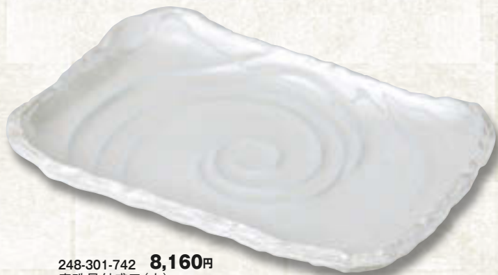
248-301-742 8,160円 真珠足付盛皿(大)(32×23×4.7) 525320174 248-302-742 4,100円 真珠足付盛皿(小)(25×20×4.3) 525320274