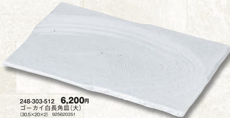
248-303-512 6,200円 ゴークイ白長角皿(大) (30.5×20×2) 925620351