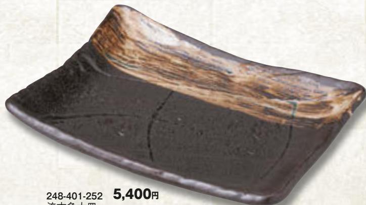
248-401-252 5,400円 流木角大皿 (30.5×24.5×5) 925640125