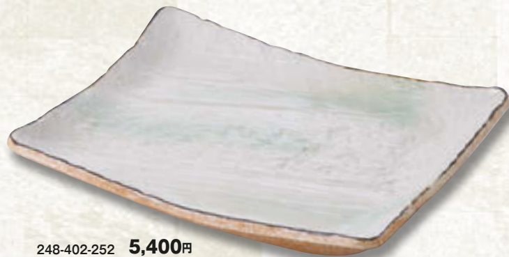
248-402-252 5,400円 安曇野角大皿 (30.5×24.5×5) 524820325