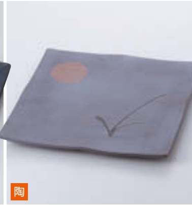
219-104-762 3,200円 おぼろ月浜付正角皿(大) (24.5×24.5×2.5) 524920276