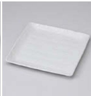
219-402-332 2,200円 粉引釉23cm正角皿(23×23×2.3) 1121940233