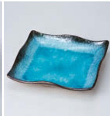
219-305-012 2,100円 藍染スカイ90正角皿(大)(23.5×23.5×4) 720730301 219-306-012 1,180円 藍染スカイ70正角皿(中)(17.5×17.5×3) 720730401