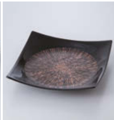
219-302-242 2,250円 刻み乱十草漆黒手引正角7.5皿(23×23×5) 525530724 219-303-242 880円 刻み乱十草漆黒手引正角5.5皿(17.3×17.3×3.5) 525530824 219-304-242 500円 刻み乱十草漆黒手引正角4.5皿(13.5×13.5×3) 525530924