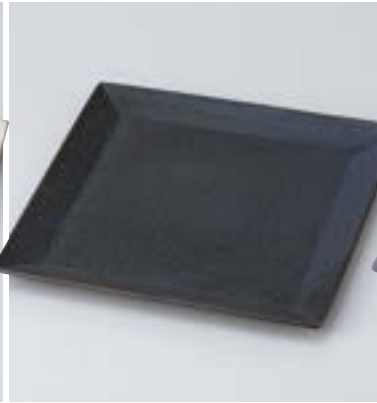
219-103-542 3,500円 紺斑点 正角皿(特大) (26×26×2) 821420554