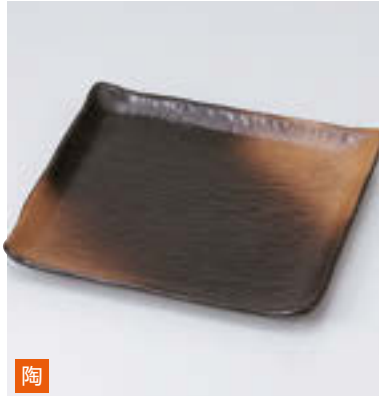
219-101-512 2,750円 黒備前櫛目正角皿(607002) (24×24×2.5) 922330151