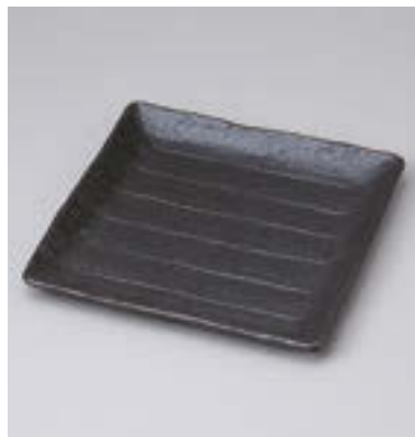
219-401-332 2,200円 黒結晶23cm正角皿(23×23×2.3) 1121940133