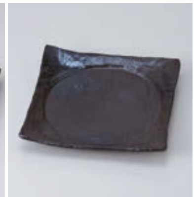
219-404-082 1,800円 東山風月19cm正角皿(19×3) 620630408