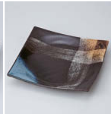
219-307-242 2,250円 刷毛巻正角7.5皿(22.5×22.5×3.7) 720840724 219-308-242 880円 刷毛巻正角5.5皿(17×17×3) 720840824 219-309-242 500円 刷毛巻正角4.5皿(13.5×13.5×2.7) 720840924