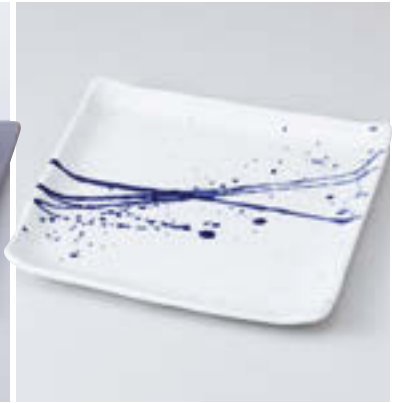
219-105-612 2,900円 呉須吹節目 正角皿 (24×24×2.5) 1022520761