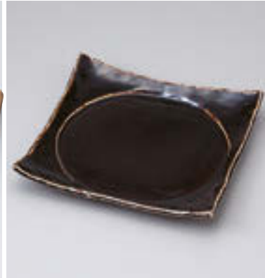
219-202-632 3,000円 秋風22cm正角皿(22.2×22.2×4) 1121920163 219-203-632 2,000円 秋風19cm正角皿(19×18.7×3) 1121920263