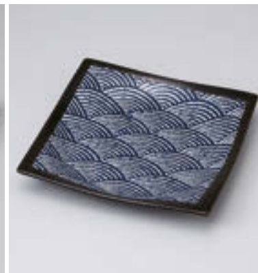
219-403-242 2,200円 青海波7.5皿(23.5×23.5×4.5) 1121930924