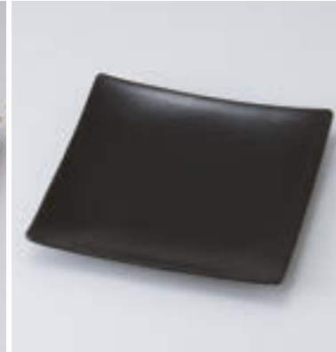
219-204-792 2,600円 黒正角大皿(22.7×22.7×3.2) 619840373 219-205-792 1,320円 黒6.0正角皿(17.8×17.8×2.7) 519840773 219-206-792 1,000円 黒正角銘々皿(13.6×13.6×2.1) 519840873