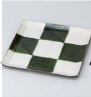
219-101-472 3,300円 織部市松コヨリ大皿(24.5×24.5×2) 821430147 219-102-472 2,000円 織部市松コヨリ正角皿(16.3×16.3×2.2) 821430247