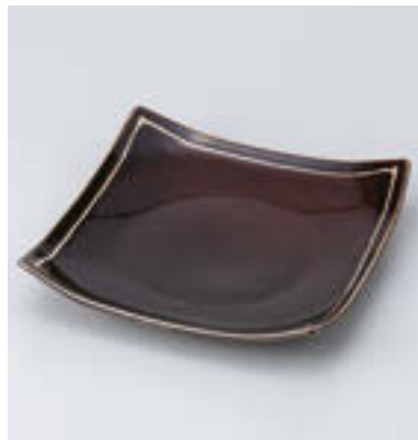
219-301-262 2,550円 琥珀22cmスクエアプレート (22×22×4.5) 821710526