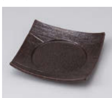
215-501-702 1,000円 鉄仙花松花堂四方皿 (11.3×11.3×2.8) 1121530970