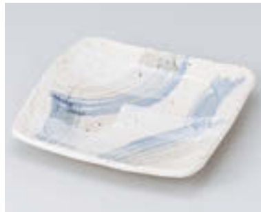
215-301-542 2,000円 さざれ正角皿 (18.5×18.5×3.5) 921920254