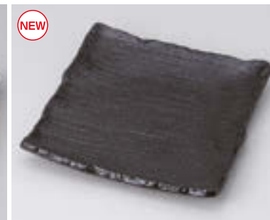
215-404-612 1,300円 黒備前凜19cm正角皿 (19.5×19.5×3) 1221540461