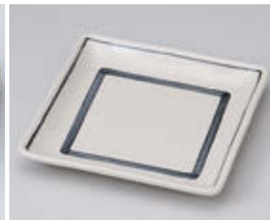
215-403-792 1,300円 布目帯ライン新6.0正角皿 (21×14.5×2.2) 1121540179