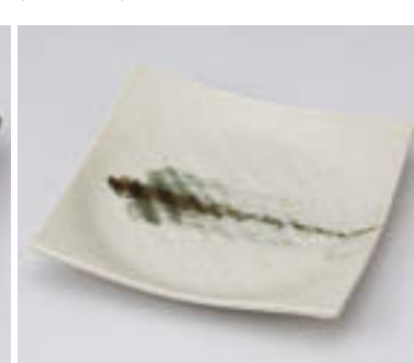
215-504-242 840円 せせらぎ5.5正角皿 (17×17×3) 1121540824