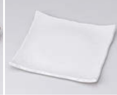
215-105-262 2,350円 白マツちぎり四方上21.5cm角皿(21.5×21.5×2.7) 1221510526 215-106-262 980円 白マツちぎり四方上15cm角皿(15×15×2) 1221510626