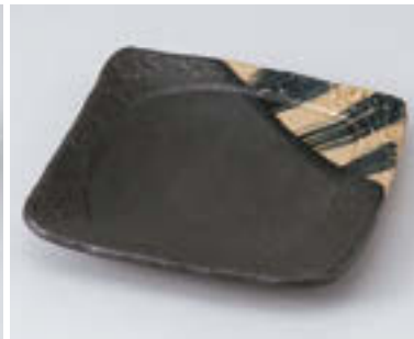
215-302-352 1,800円 黄八丈石目正角皿 (18.5×18.5×3.5) 1022120435