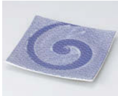
215-201-332 2,600円 青海波白渦19.5cmスクエアプレート(19.7×3) 921950533 215-202-332 2,000円 青海波白渦15.5cmスクエアプレート(15.8×2.4) 921950633