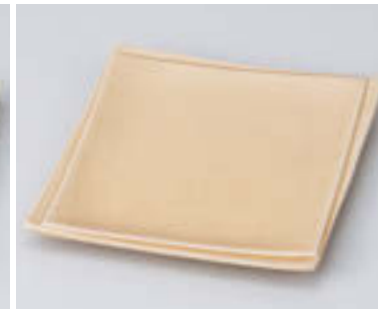
215-305-702 1,750円 洋風新正角6寸皿(ページュ)(17.8×17.8×2) 821930570 215-306-702 1,000円 洋風新正角銘々皿(ページュ)(13.5×13.5×2.2) 821930670