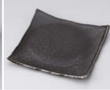
215-103-262 2,350円 黒マツちぎり四方上21.5cm角皿(21.5×21.5×2.7) 1221510326 215-104-262 980円 黒マツちぎり四方上15cm角皿(15×15×2) 1221510426