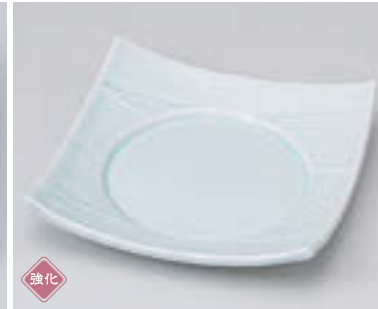
215-205-702 2,200円 青白磁6.0四方皿(17.5×17.5×3.6) 1121530470 215-206-702 1,650円 青白磁5.0四方皿(14.3×14.3×3.3) 1121530570 215-207-702 1,000円 青白磁松花堂四方皿(11×11×2.5) 1121530670