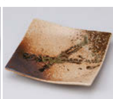
215-502-242 840円 信楽織部5.5正角皿 (17×17×3) 1121530324