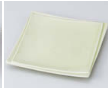
215-303-702 1,750円 洋風新正角6寸皿(ヒワ)(17.8×17.8×2) 821930370 215-304-702 1,000円 洋風新正角銘々皿(ヒワ)(13.5×13.5×2.2) 821930470