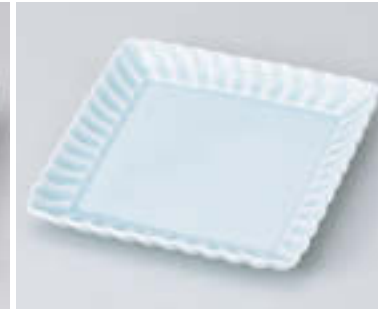
215-208-512 2,300円 菊割 青白17cm正角皿 (17.8×17.8×2.6) 821940751