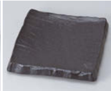
215-203-512 2,350円 備前黒荒彫角皿(大)(20×20×3) 620040951 215-204-512 1,500円 備前黒荒彫角皿(小)(15.3×15.3×3) 620041051