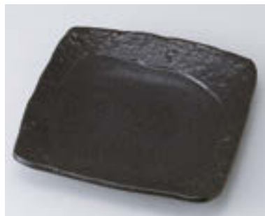
215-401-352 1,750円 黒石目6.0角皿 (18×18×3.3) 520720135