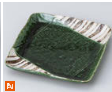
215-402-152 1,500円 織部十草 正角7.0皿 (18.5×18.3×2.8) 810550315