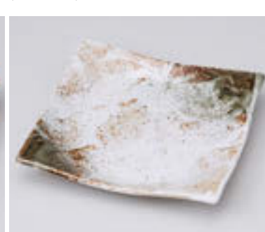
215-503-242 840円 雪志野5.5正角皿 (17×17×3) 1121530224