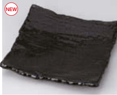
215-101-252 3,000円 御影23cm正角皿 (23.3×3.7) 1221510125