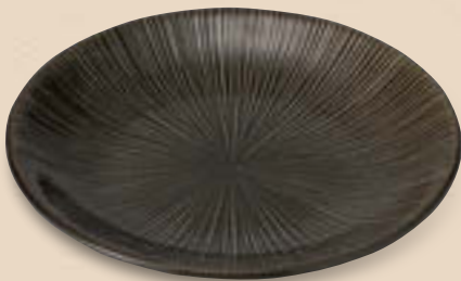
207-401-472 1,850円 千段織部7.5皿(24×3.7) 820440347