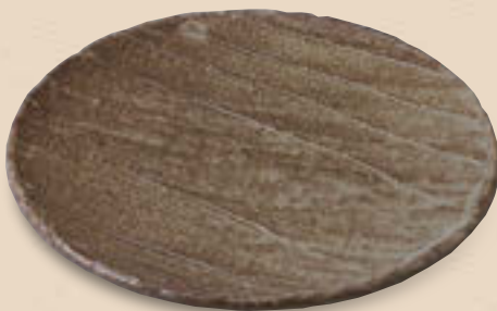
207-301-252 2,300円 越前8.0皿(25×2.1) 519720325