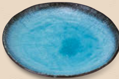
207-302-012 1,920円 藍染スカイ80丸皿(24×23×4) 720210401