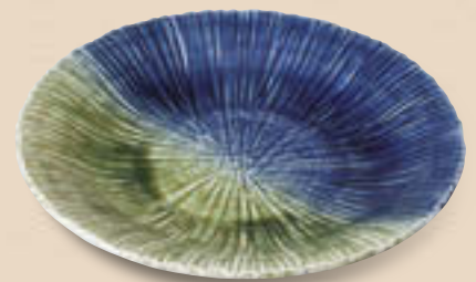
207-403-352 1,150円 二色流し彫十草大皿(25×3) 1021410335