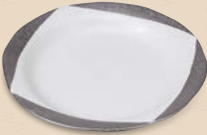
207-101-352 3,000円 プラチナスクエアつば付丸6.5皿 (19.5×2.3) 1120910135