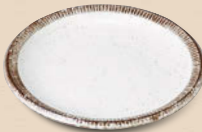
207-402-352 1,250円 洩錆粉引大皿(24×3) 719840235