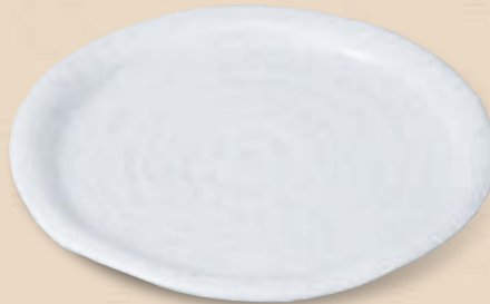
207-202-262 2,300円 白釉波皿(24.6×2.5) 820630126