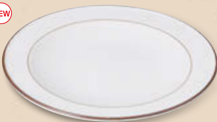
207-501-412 1,150円 ブラウンエッジ 8.0大皿 (24.6×2.7) 1220750141