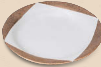
207-102-352 3,000円 ゴールドスクエアつば付丸6.5皿 (19.5×2.3) 1120910235