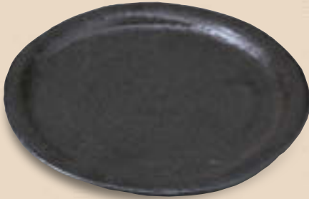
207-201-262 2,300円 結晶黒マット8.0皿(φ24.7×2.6) 1021530426