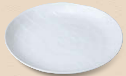
207-503-262 950円 ジュピターW7.5皿(24.5×3) 820540126