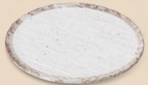
207-203-252 2,300円 白唐津8.0皿(25×2.5) 921230425