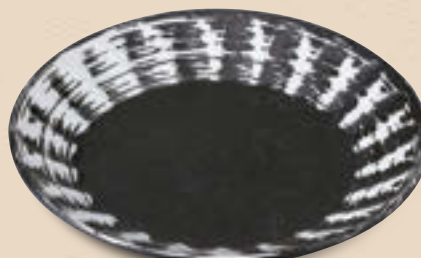
207-502-312 1,400円 備長しのぎ8.0皿(24.6×3.1) 1021740911