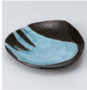
195-301-352 1,000円 パステルブルー5.0三角皿 (16.4×16.4×2.4) 920740735