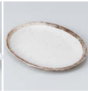
195-104-252 1,200円 白唐津小判皿 小 (21.5×17.5×1.7) 718430425