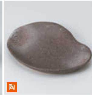
195-305-522 830円 古窯豆型皿 (17×13.2×2) 518850152