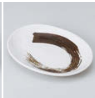
195-403-742 820円 刷毛目6.0小判皿(白) (18×14×2.2) 718450474