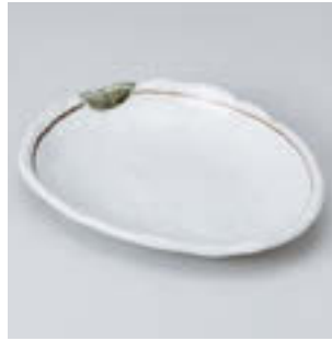
195-201-792 1,100円 志野茶ライン7.0変形皿 (20.5×16.5×2.8) 519320579