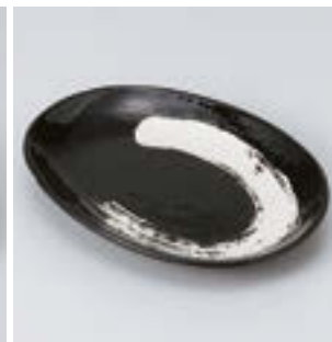
195-404-742 820円 刷毛目6.0小判皿(黒) (18×14×2.2) 718450574