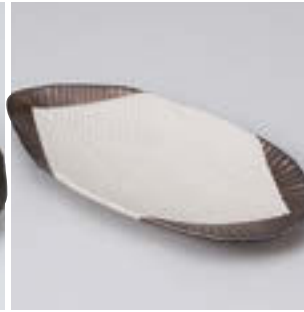
195-203-352 1,080円 水車(白)葉型長皿(小) (21.5×10.5×2) 1120340535