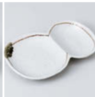
195-506-792 660円 志野茶ライン得々皿 (18.5×11.8×2) 718910179