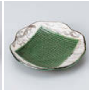
195-205-252 1,300円 織部トチリ花型5.0取皿 (15.5×15.5×3) 619010425