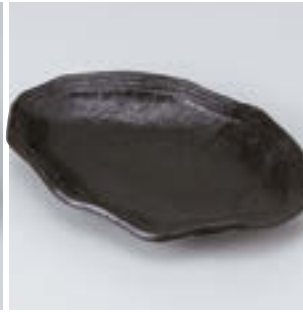
195-202-352 1,450円 変形皿(大) 油滴天目 (23.5×16.5×3.8) 920920535