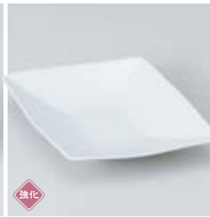
195-103-782 1,430円 青磁菱型フルーツ皿 (19.1×14.5×3.4) 618420378