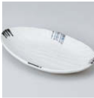
195-101-352 1,230円 竜吟四ッ足楕円鉢 (23.5×14×4) 719410235