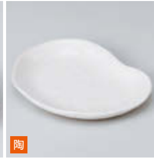
195-304-522 920円 斑点粉引豆型皿 (17×13.2×2) 519050452