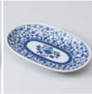
195-303-312 980円 古伊万里唐草小判皿 (18.7×12.8×2.3) 1020830511