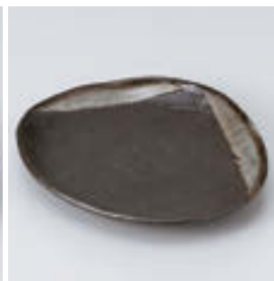
195-503-512 770円 柳ヶ瀬 三角中皿 (17.4×15.3×2.4) 718530551