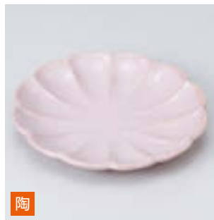
195-401-512 910円 ピンクうのふ花びら取皿 (16.6×2.5) 920830351