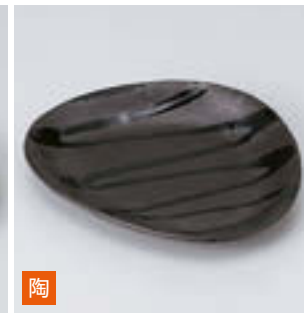
195-105-412 1,160円 ひるがの 三角6.0皿 (18.5×15×2.5) 820130341