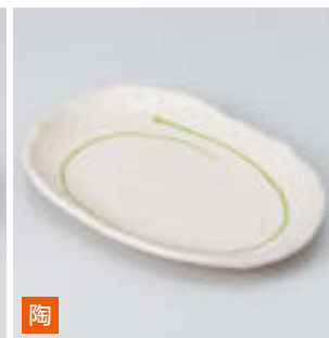
195-505-792 550円 グリーンライン小判皿 (17.5×12.3×1.7) 718840479