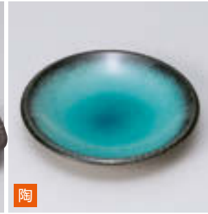
195-204-512 1,650円 スカイブルー厚口5寸皿 (16×2.5) 1120410551