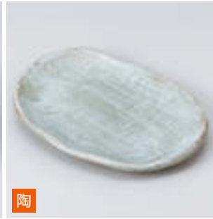
195-302-742 1,100円 刷毛目青雲足付皿 (18×14.3×2.3) 519050374