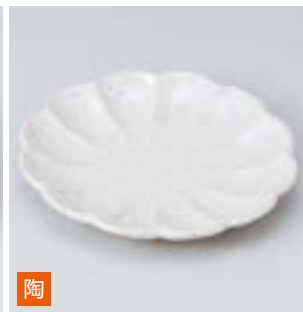
195-402-512 910円 白うのふ花びら取皿 (16.6×2.5) 920830451