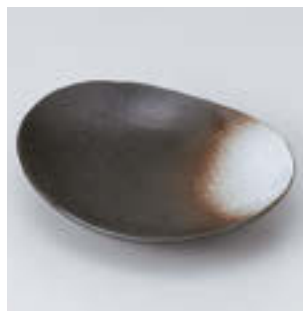
195-501-612 770円 白吹天目楕円皿大(17.7×15.2×4) 718850561 195-502-612 450円 白吹天目楕円皿小(12.8×11.8×3.6) 718850661