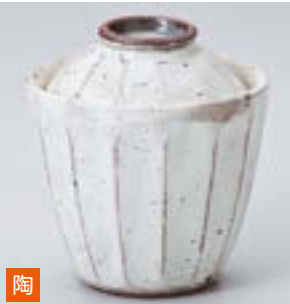
176-101-792 3,600円 粉引面取りむし碗 (10.3×10・200cc) 516110146

刺身 向付 中鉢 小鉢 小付 珍珠 松花堂 前菜皿 付出皿 焼物皿 天皿 香水 蓋物 蒸碗 土瓶蒸し 小皿 和皿 多用皿 多用鉢 盛込鉢 盛込皿 酒器 フリー カップ そば用品 薬味皿 めん皿 井 多用井 波佐見焼 特選 茶漬碗 飯碗 土瓶 ポット 急須 湯呑 千茶 カスター 卓上小物 箸置 レンゲ スプーン 灰皿