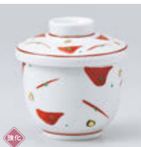
176-201-262 2,650円 赤絵点紋小むし (7.3×8.5・170cc) 917620226