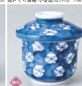
176-305-782 1,750円 梅ずくしむし碗(小) (7.2×8.3・140cc) 515951077