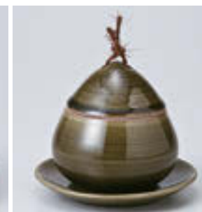
176-205-252 2,200円 織部釉くり蒸碗 小(8.5×8.8・160cc) 715810325