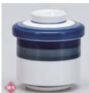
176-403-742 1,530円 二色ラインむし碗 (6.7×8.5・160cc) 515920574