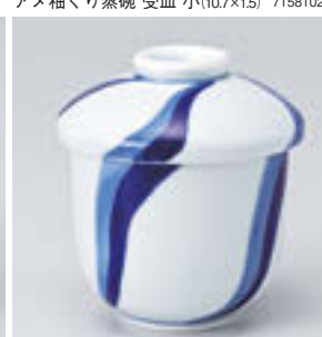
176-303-252 2,100円 流水小むし碗 (7.2×9.2・170cc) 1117630225