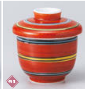
176-103-262 3,000円 赤絵駒筋小むし (7.4×8.7・約170cc) 816610126