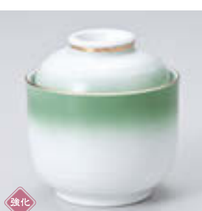
176-301-702 2,310円 グリーンむし碗 (7.9×8.4・160cc) 516110671