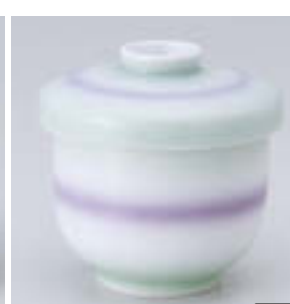
176-503-612 1,300円 並形蒸碗(中)二色吹(7.6×8.7・190cc) 515640661