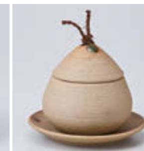
176-207-252 2,000円 焼ぐくり蒸碗 小(8.5×8.8・150cc) 715810725