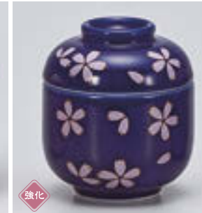
176-104-052 2,900円 桜ふぶきミニむし碗 (7×8.2・125cc) 516010505