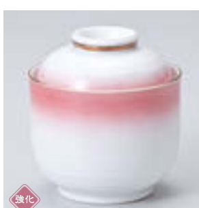
176-302-782 2,310円 ピンクむし碗 (8×8.4・160cc) 516110578