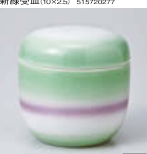
176-501-512 1,150円 夏目形むし碗(中)二色吹(111-12B) (7.8×7.8・180cc) 715820851