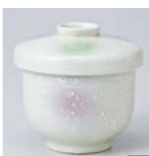
176-502-512 1,200円 並形蒸碗(中)三色吹(115-09) (7.6×8.7・190cc) 715820451