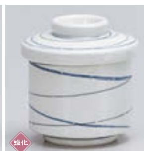
176-404-782 1,530円 かすみ二色釉渦むし碗 (6.7×8・150cc) 515920478