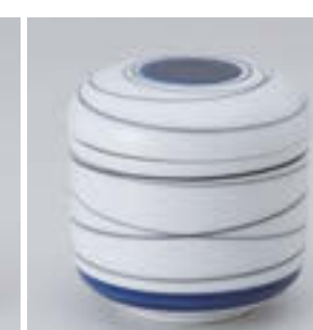
176-506-152 1,200円 ルリうず丸型むし碗 (8×8・180cc) 515730615