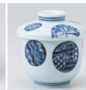
176-406-262 1,450円 丸紋むし (7.5×8.5・約170cc) 917720626