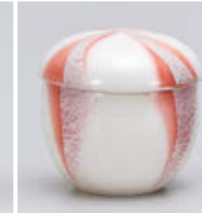
176-105-352 2,720円 銀彩オレンジ捻り小むし碗 (7.5×6.7・100cc) 516010235