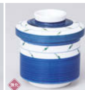
176-405-782 1,390円 花つなぎむし碗 (6.7×8・150cc) 816630278