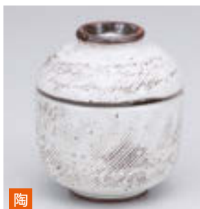
176-202-072 2,400円 粉引くし目小むし碗 (7.2×8.3・130cc) 101781047