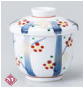
176-102-262 4,150円 手描き紅梅小むし (7.5×8.5・約190cc) 816210226