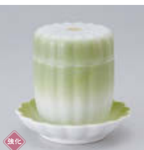
176-401-742 1,880円 新緑菊型むし碗(7×8.8・150cc) 515720177