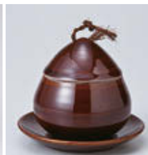
176-203-252 2,200円 アメ釉くり蒸碗 小(8.5×8.8・160cc) 715810125