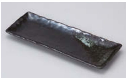
160-101-792 900円 軽量白吹きサンマ皿(29.5×11.3×2.2) 1116150279