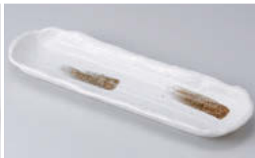
160-103-612 840円 厚洩長角皿 茶刷毛 白(33.3×10.5×3) 514730361