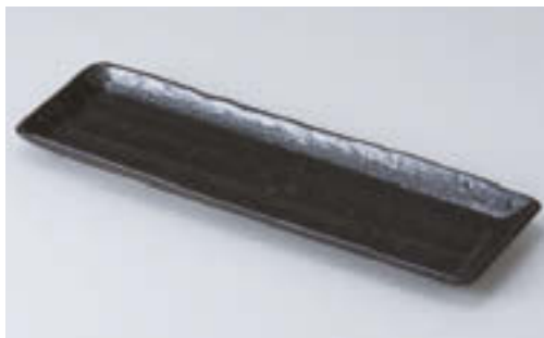
160-202-612 840円 11.0長角皿 天目(33.8×10.4×2.2) 514710361