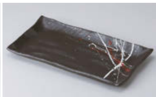
160-503-152 2,100円 潮 串目長角大皿(31.5×17×2.6) 514920115

波佐見焼 特選 茶漬碗 飯碗 土瓶 ポット 急須 湯呑 干茶 カスター 卓上小物 箸置 レンゲ スプーン 灰皿