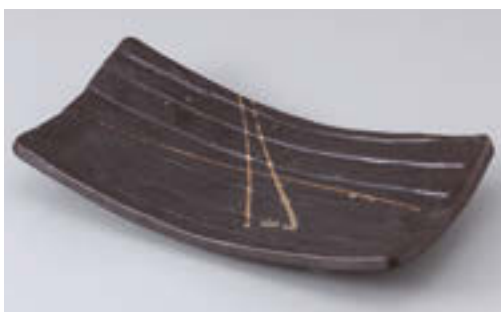
160-301-082 2,850円 筆流し(黒)足付まな板皿(29×16×4) 1015830308