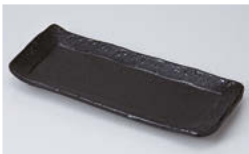
160-502-542 2,300円 黒粒長角大皿(33.5×14.5×3.5) 714230354