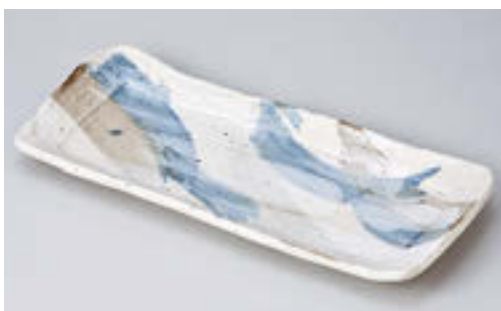
160-501-542 2,400円 さざれ長角大皿(33.5×14.5×3.5) 714230254