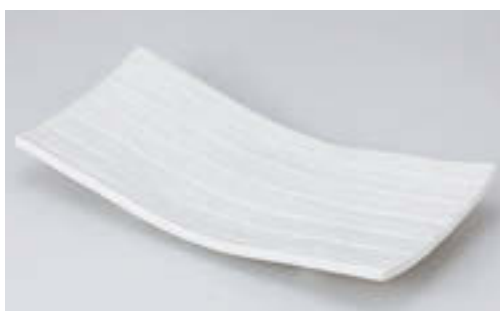
160-402-152 3,750円 粉引四足まな板皿(31×16×4.5) 915820215