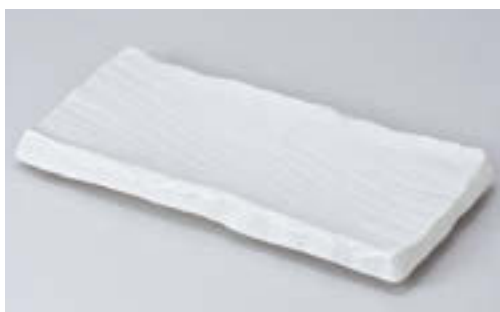
160-302-512 2,750円 白マツ荒彫まな板皿(32.3×15.9×3.7) 615050151