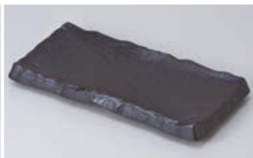
160-303-512 2,750円 備前黒荒彫まな板皿(32.3×15.9×3.7) 615050251