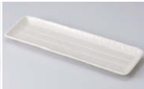
160-203-612 840円 11.0長角皿 クリーム(33.8×10.4×2.2) 514720161