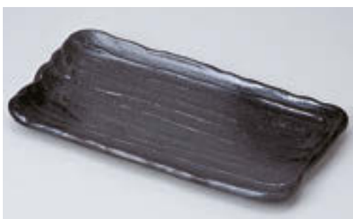
160-401-402 3,920円 黒金彩吹 多用皿(33.3×18.5×2.8) 714220140