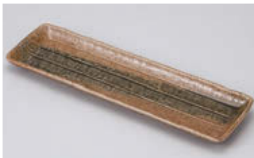
160-102-402 750円 伊賀 長角皿(大)(33×10×2.5) 1116150140