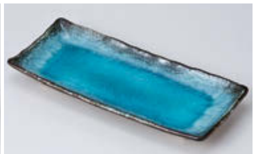
156-503-012 1,150円 藍染スカイさんま皿(29×12.5×3.4) 713840301