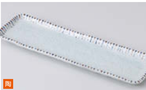
156-501-792 1,200円 二色十草特長皿(33.2×9.8×2) 1015650379