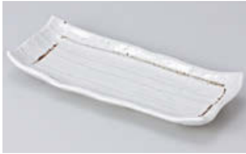
156-202-472 1,250円 粉引ライン波型さんま皿(28.5×12.5×4) 614820147