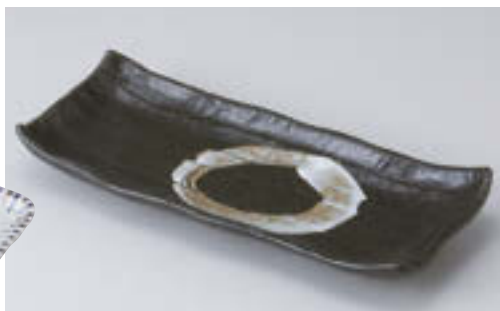
156-502-402 1,110円 うず潮長角皿(28×12×4) 514610140