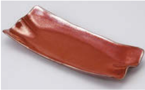
156-101-152 1,500円 波 赤長盛皿(28×12.3×3.7) 1115610315