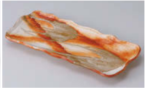
156-103-352 1,280円 手造りひだすきサンマ皿(28.5×12.5×3) 514420335