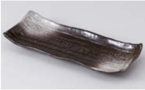
156-201-472 1,250円 あけぼの測波さんま皿(28.5×12.5×4) 1015440147