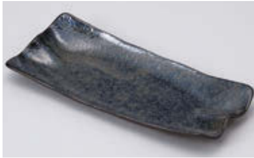
156-102-152 1,500円 波 ルリ長盛皿(28×12.3×3.7) 1115610215