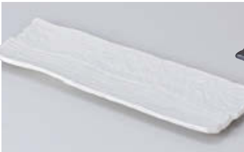
156-301-612 1,300円 白楽32cm長皿(32.5×10.8×2.5) 614630261