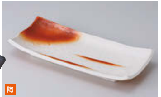
156-303-152 1,300円 暁(あかつき)サンマ皿(28.8×13×2.8) 514520315