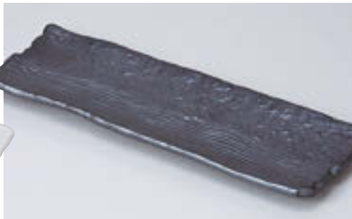
156-302-512 1,300円 黒楽長皿(609003)(32.5×10.8×2.5) 713810351