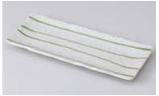
156-203-472 1,200円 グリーン流しさんま皿(28.8×12×2) 1015330347