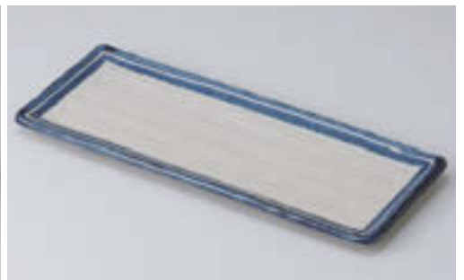
156-403-742 1,100円 測ライン長魚皿(29.5×11.5×1.8) 514610274