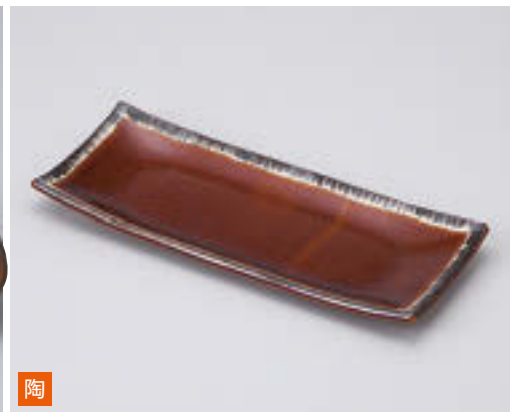
陶 152-403-752 2,000円 鉄釉十草さんま皿(27×11×2.5) 1115250175