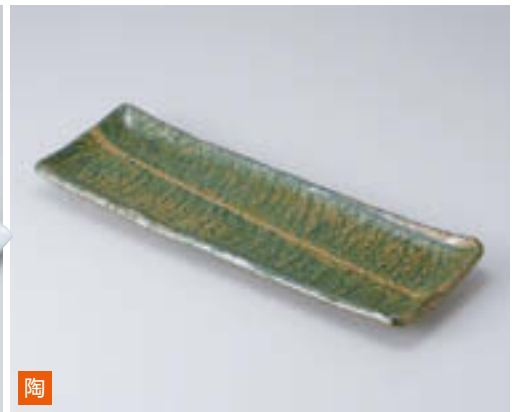
陶 152-303-742 2,350円 緑彩貫入長魚皿(小) (29.5×12×2.8) 514120374