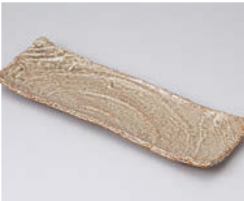
152-201-632 3,100円 窯変いらば長角盛皿(36×12×3) 1124840363