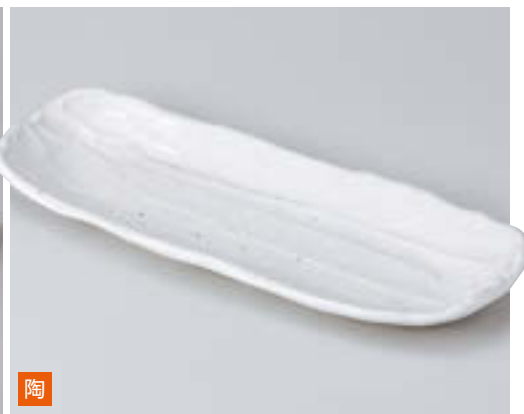
陶 152-103-412 3,400円 白釉荒ソギ盛込み皿(36×14×3) 814050341