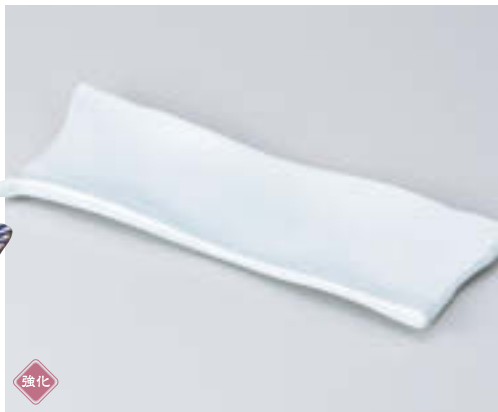
152-302-262 2,400円 青白磁ちぎり長皿(33.5×12×2) 814110126