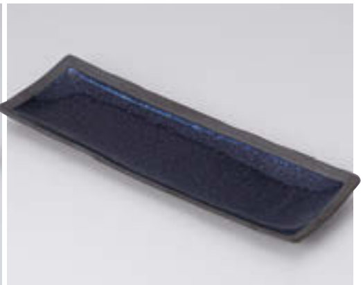
152-203-472 2,500円 桃山藍彩長皿(33.3×11.2×2.5) 1215220347