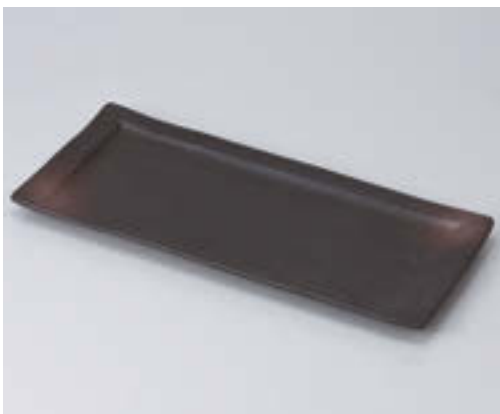
152-101-522 3,280円 備前風回角焼物皿(大) (31.5×14×2) 614340252