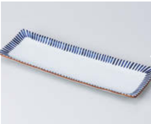
152-301-752 2,500円 手描き藍十草長角皿(大) (33.5×11×2) 814050175