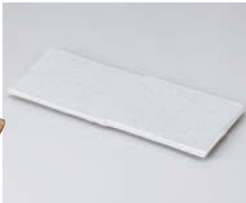
152-202-612 2,600円 玄木挽きまな板皿(30.5×12.5×2) 915040161