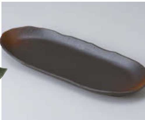
152-402-522 2,160円 備前吹楕円長皿(34.5×13×3) 514140352