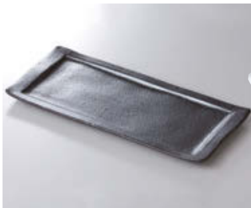
152-102-572 3,100円 黒銀彩大焼物皿(31.5×14×2) 612340157