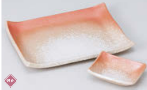
強化 142-202-782 2,280円 雪どけ8.0焼物皿(21.3×15.6×2.7) 513240178 142-203-782 760円 雪どけ長角千代口(9.3×6.8×2.5) 513240278