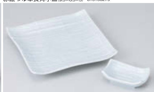
142-505-792 1,500円 青磁すだれ正角皿(18×18×2.7) 914040179 142-506-792 400円 青磁すだれ小皿(9.3×6×2.7) 712510679