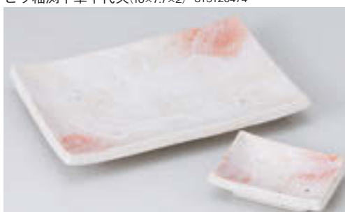
142-503-162 1,570円 桜志野8.0焼物皿(20.8×14×3) 513350716 142-504-162 520円 桜志野千代口(9.5×6.8×2.6) 513350816