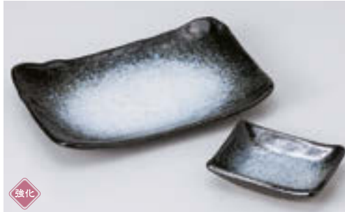
強化 142-303-742 1,800円 雲海7.0焼物皿(19.7×12.5×3) 513320174 142-304-742 830円 雲海長角千代口(9.4×6.8×2.5) 513320274