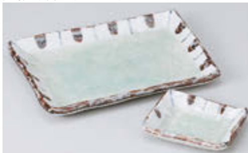
142-404-742 1,610円 ヒワ釉十草7.0焼物皿(20.8×14.6×2.1) 813120374 142-405-742 520円 ヒワ釉十草千代口(10×7.7×2) 813120474