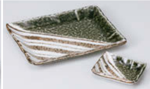
142-305-742 1,720円 織部ストライプ8.0長角皿(21.5×16.2×2) 513320377 142-306-742 1,560円 織部ストライプ7.0長角皿(20×14.4×2) 513320477 142-307-742 510円 織部ストライプ長角千代口(9.7×7.5×2) 513320577