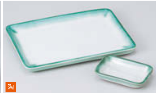
陶 142-105-252 2,600円 ヒワ流焼物皿(21.5×14.5×2) 513230325 142-106-252 850円 ヒワ流角千代口(10×6.5×2) 513230425