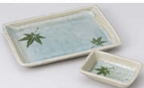
142-501-742 1,650円 ビードロ紅葉7.0焼物皿(21.8×14.2) 542601874 142-502-742 650円 ビードロ紅葉長角千代口(10.4×7.2×2.3) 542601674