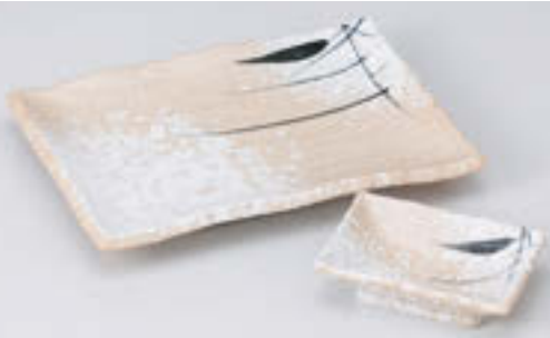
142-301-262 2,000円 あけぼの焼物皿(21×14.7) 913940326 142-302-262 720円 あけぼの角千代口(10×7) 913940426