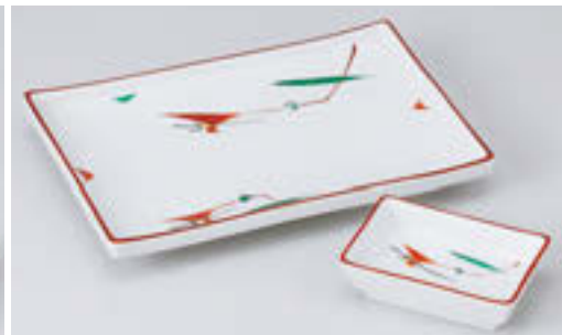
142-406-792 1,550円 赤絵つゆ草長角焼物皿(21×14.3×3) 813130179 142-407-792 580円 赤絵つゆ草長角小皿(9.5×6.5×3) 813130279