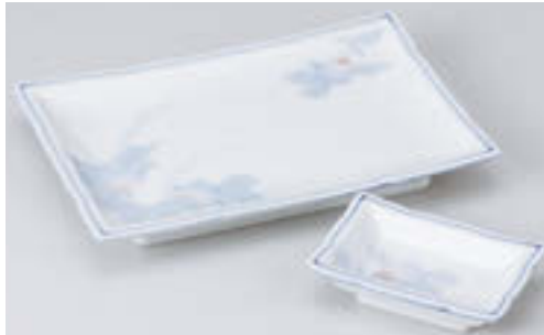
142-103-262 3,200円 まごころ角淵焼物皿(21.7×14.5×3) 813020326 142-104-262 1,100円 まごころ角淵千代口(10.3×7×2.8) 813020426