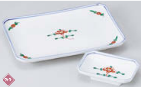
強化 142-101-262 4,150円 錦宝来焼物皿(21.3×14.3×2.8) 813010526 142-102-262 1,500円 錦宝来角千代口(10.4×7×2.6) 813010626