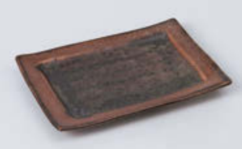
142-201-152 2,300円 回角茶焼物皿 (19×13.5×2) 613610115