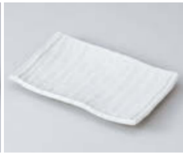
139-102-352 1,000円 白マット 焼物皿 (20.8×13×2.8) 1013450335