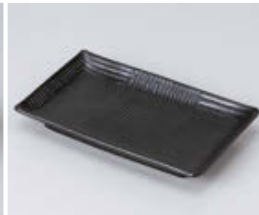
139-204-612 660円 櫛目黒 焼物皿 (20.7×13×2.7) 913310261