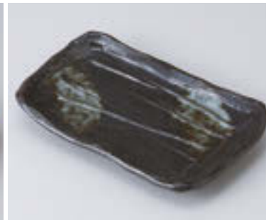
139-304-612 630円 そぎ型焼物皿 天目白吹 (21×13.5×2.8) 513150261