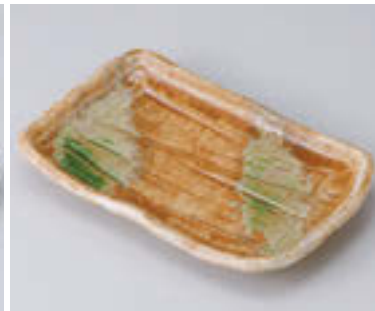
139-303-612 630円 そぎ型焼物皿 伊賀 (21×13.5×2.8) 513150161