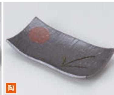
139-404-762 1,200円 おぼろ月浜付焼物皿 (19.5×10.3×2) 513630376