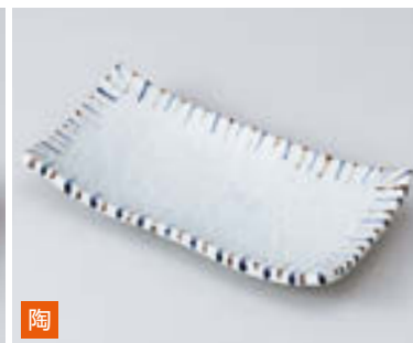
139-504-702 1,000円 荒目青磁二色十草浜付焼物皿 (19.5×10×3.3) 1014450370