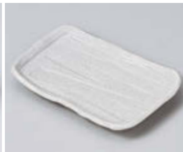
139-403-612 630円 そぎ型焼物皿 粉引 (21×13×2.8) 613340461