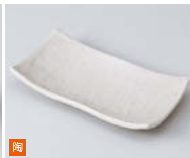
139-503-792 1,150円 白志野浜付焼物皿 (19×10×3.5) 1014450579