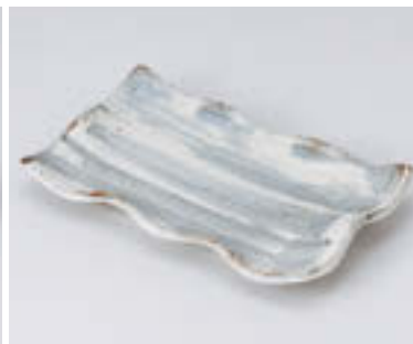
139-402-402 540円 藍染波形焼物皿 (20.8×12.8×3) 913320440