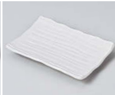
139-202-612 660円 木目 焼物皿 白 (20.8×13×3) 613340261