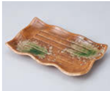
139-301-612 630円 伊賀波型焼物皿 (20.5×12.5×3) 712350261