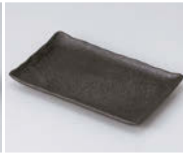
139-103-612 1,250円 京天目庵 焼物皿 (22.2×14×2.7) 913220361