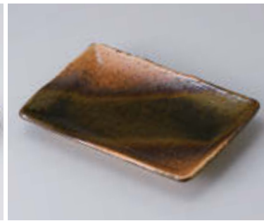
139-104-302 750円 石織織部焼物皿 (21×13×3) 513020230