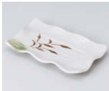
139-401-402 540円 金彩芦波形焼物皿 (20.8×12.8×3) 913320340