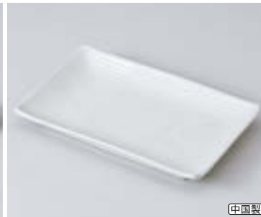
139-203-522 570円 粉引 クシメ焼物皿 (21×13×3) 1013620452