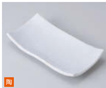
139-501-782 1,100円 均窯焼物皿 (19.5×10×3.5) 513120273