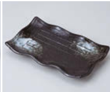
139-302-612 630円 天目白吹波型焼物皿 (20.5×12.5×3) 712350161