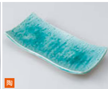
139-502-792 1,150円 トルコ浜付焼物皿 (19×10×3.5) 1014450479