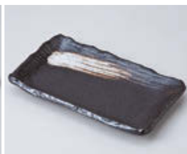
138-402-612 1,100円 潤厚千筋焼物皿黒刷目 (22.2×13.5×2.6) 712320161