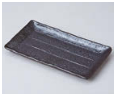
138-301-782 850円 黒釉焼物皿(21×11.6×1.8) 712230478