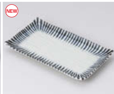
NEW 138-202-162 1,050円 呉須十草 そぎ焼物皿 (22.5×13.3×2.5) 1213820216