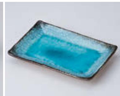
138-204-012 1,000円 藍染スカイ焼物皿 (21.5×14×3) 712140301