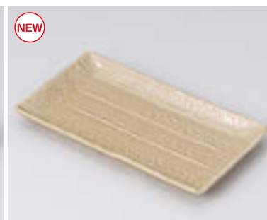
NEW 138-503-782 900円 黄釉 焼物皿 (21.6×11.6×1.8) 1213850378