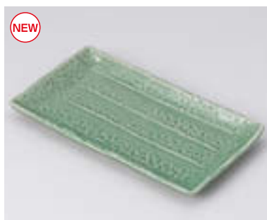
NEW 138-501-782 900円 緑釉 焼物皿 (21.6×11.6×1.8) 1213850178