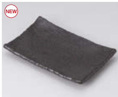
NEW 138-201-612 1,050円 黒備前濃焼物皿 (22×15×3) 1213820161