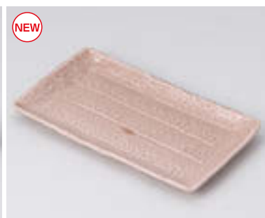
NEW 138-502-782 900円 ピンク釉 焼物皿 (21.6×11.6×1.8) 1213850278