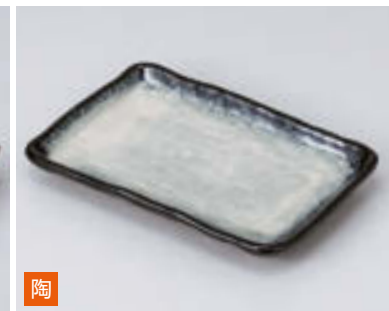
陶 138-304-792 1,150円 雲竜7.0長角皿(20.7×14×2.5) 913250179 138-305-792 660円 雲竜6.0長角皿(17.5×12×2.2) 913250279