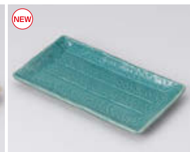
NEW 138-504-782 900円 青釉 焼物皿 (21.6×11.6×1.8) 1213850478