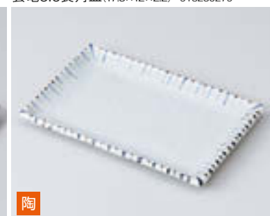
陶 138-404-702 1,000円 荒目青磁二色十草新焼物皿 (20×13.5×1.5) 1013610370