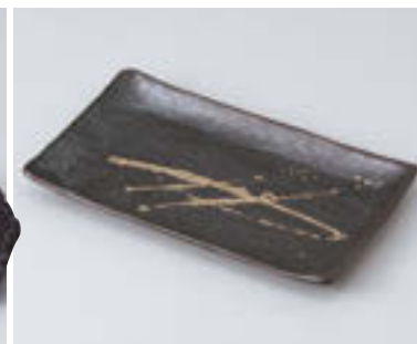
138-103-152 1,200円 筆流し木肌焼物皿 茶 (24×14.5×2.3) 1013430215