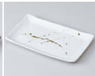
138-104-152 1,200円 筆流し木肌焼物皿 白 (24×14.5×2.3) 1013430315