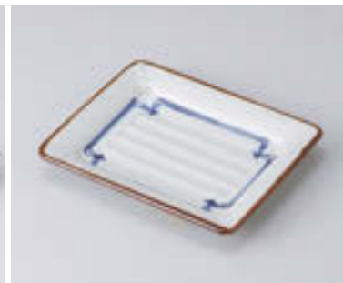
138-203-302 980円 灰釉染付焼物皿 (17.6×14.5×2.5) 512930130