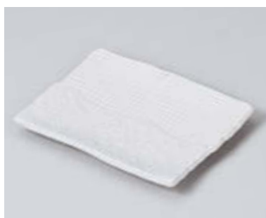
138-401-612 1,200円 白染焼物皿 (20.7×14×2.6) 612950561