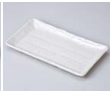
138-302-782 850円 白釉焼物皿(21×11.6×1.8) 712230378