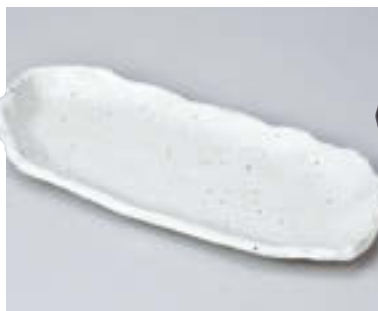
138-101-612 1,250円 ちぎり長皿白 (28×12.8×2.5) 714030361