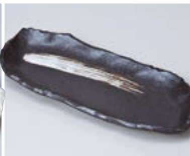
138-102-612 1,250円 ちぎり長皿黒刷目 (28×12.8×2.5) 714040161