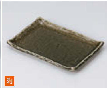
135-202-472 1,600円 織部7.0長角皿 (20.8×14.8×2.5) 913040247