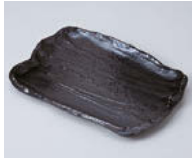
135-201-402 1,920円 黒金彩吹 焼物皿 (22×15×2.3) 711940240