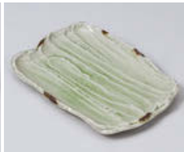
135-502-352 1,750円 笹みどり荒ソギ焼物皿 (22×15×2) 613030435