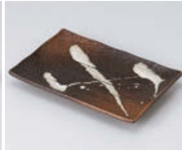
135-203-632 1,600円 南蛮23.5cmたたき皿 (23.5×16.1×3) 913050263