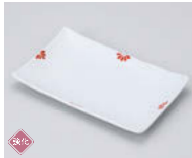
135-401-742 1,540円 小花(赤) 焼物皿 (20×13×2.5) 1113910274