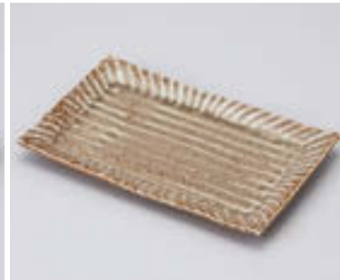
135-404-632 1,800円 窯変いらぼ22cm焼物皿 (22.2×14×2.3) 1113530263