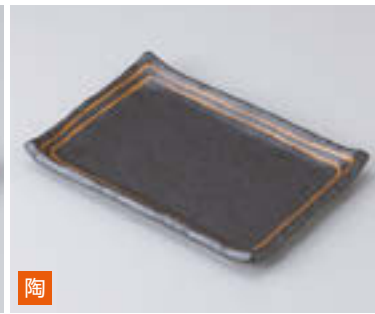
135-104-472 1,650円 黒ライン7.0長角皿 (20.3×14.3×2.3) 512540247