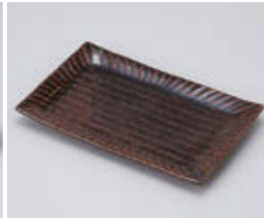
135-403-632 1,800円 窯変天目22cm焼物皿 (22.2×14×2.3) 1113530163