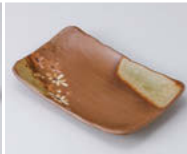
135-503-742 1,450円 南蛮秋桜花7.0焼物皿 (19.5×12.5×2.5) 512630174