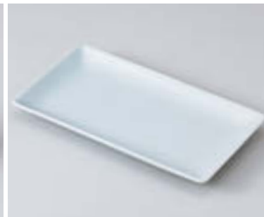
135-504-612 1,500円 青磁 千段焼物皿 (23.8×13.5×2.5) 1013130361