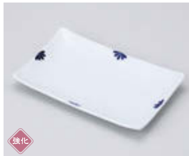
135-501-782 1,540円 小花 青 焼物皿 (20×13×2.5) 1113910178