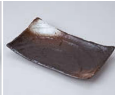
135-305-612 1,550円 白吹天目極焼物皿 (22.8×14×3.8) 711640361