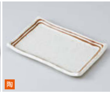
135-102-472 1,650円 クリーム粉引ライン7.0長角皿(20.5×14.5×2.5) 545200847 135-103-472 900円 クリーム粉引ライン波型長角銘々皿(15.4×11.7×1.5) 844205347