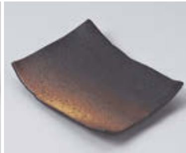
135-402-352 1,750円 黒備前四ツ足焼物皿 (21×16.5×3) 613130335