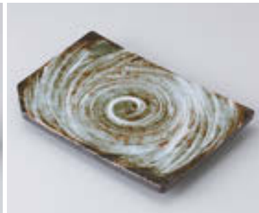
135-304-162 1,570円 白刷毛寿司皿 (21.5×14.8×2.5) 512610416