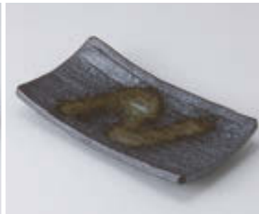
135-303-512 1,580円 南蛮Nライン焼物皿 (21.7×12×3) 512740251