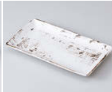
135-204-082 1,600円 錆粉引千段焼物皿 (23.8×13.5×2.5) 1013150308