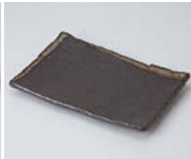
133-302-512 1,820円 柳ヶ瀬 凜焼物皿 (22.3×14.4×2.7) 711650451