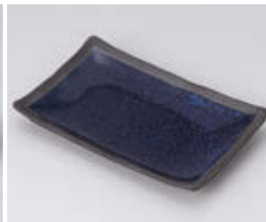
133-403-472 1,250円 桃山藍彩7.0焼物皿 (20.3×13×2.7) 1213340347