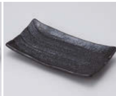
133-404-152 1,400円 波黒四ツ足焼物皿 (22.5×12×3) 1113350315