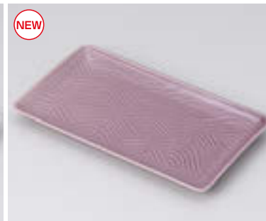
133-504-782 1,650円 青海波 長角皿 ムラサキ (22.6×13.2×1.6) 1213350478