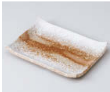
133-101-742 1,980円 白伊賀焼物皿 (21×15.5×2.5) 643005674