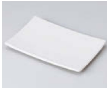
133-301-082 1,900円 白堊21cm焼物皿 (21×14×2.2) 912950108