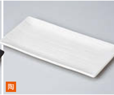
133-204-612 1,800円 ソニック9.0長角皿(白) (27.5×14×1.7) 711630361