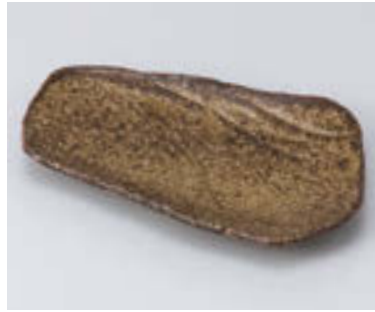
133-201-252 1,900円 不動荒磯焼物皿 (27×17×3) 812240325