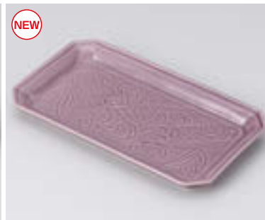
133-502-782 1,650円 彫唐草 8.0長角皿ムラサキ (22.5×13×1.8) 1213350278