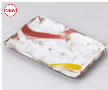
133-401-262 1,650円 染付二色刷毛粉引南蛮20.5cm長角皿 (20.5×14×2) 1213340126