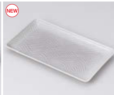
133-503-782 1,650円 青海波 長角皿 グレー (22.6×13.2×1.6) 1213350378