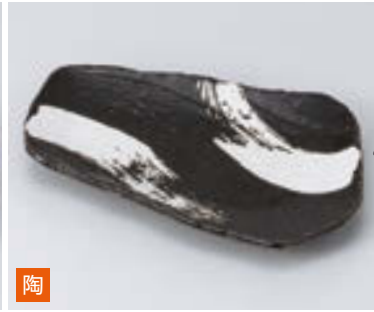
133-202-412 1,850円 黒炭白刷毛 焼物皿 (25.5×17.2×3) 812240241