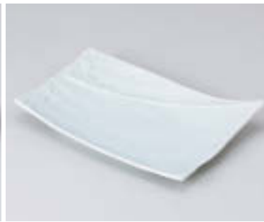
133-102-412 1,950円 清流しぶき 焼物皿 (22.5×15×4) 913010441