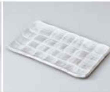
133-104-792 1,700円 ウノフネリ込8.0焼物皿 (23.5×14) 542701773