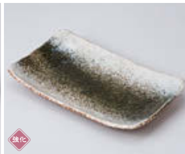
133-402-792 1,540円 緑川 新長角7.0皿 (19.5×12.5×2.8) 711550479