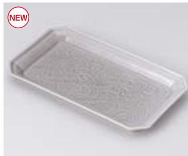
133-501-782 1,650円 彫唐草 8.0長角皿グレー (22.5×13×1.8) 1213350178