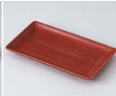
133-304-612 1,950円 千段朱 焼物皿 (23.8×13.5×2.5) 1013130261