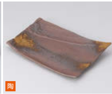
133-103-412 1,950円 奔流美膳 焼物皿 (23.5×16×3.5) 912850441