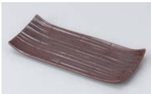
127-501-792 900円 鉄砂浜なしスダレ付出皿(20.5×9.3×2) 811660279