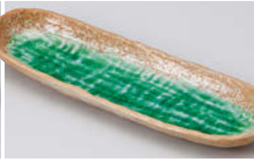
127-102-412 1,000円 貫入ヒワ長皿(30.5×10×3) 1112720141