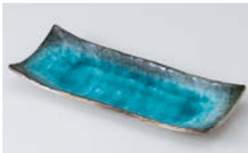
127-401-012 1,060円 均窯スカイ付出皿(24.1×9.7×2.8) 1012540201