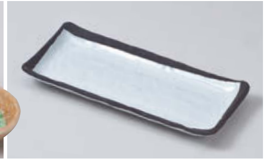
127-103-472 1,000円 桃山(石目)7.0付出皿(21.7×10.2×2.3) 612010347