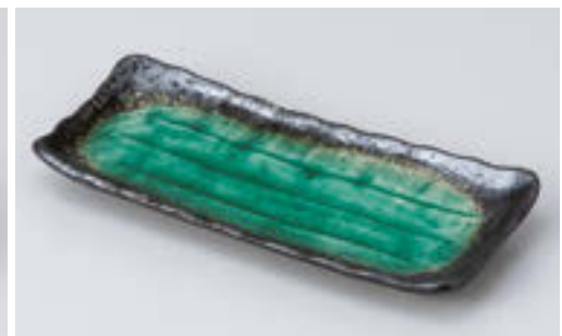
127-503-472 880円 深海グリーン付出皿(22.8×9.5×2.5) 811730247