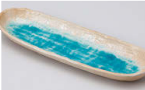
127-201-412 1,000円 貫入水色長皿(30.5×10×3) 1112720241