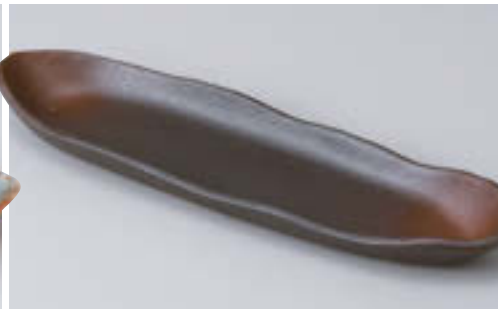
127-302-522 950円 備前吹付出皿(27.8×7.8×2.5) 511840252