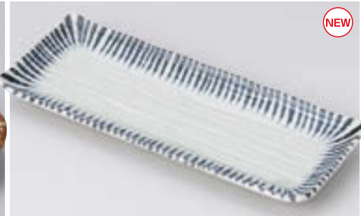
127-203-162 1,100円 呉須十草 そぎ長角皿(27.5×11.1×2.8) 1212720316