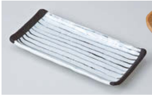
127-101-472 1,050円 いぶし黒十草付出皿(21.5×10.2×2.5) 710950147