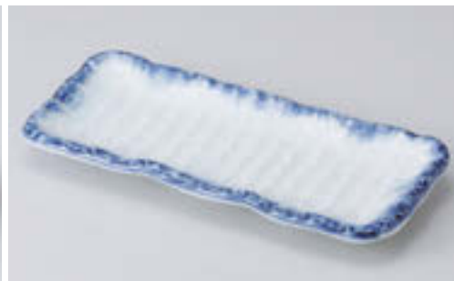
127-402-302 950円 呉須刷毛付出皿(22×10×2.6) 511910130