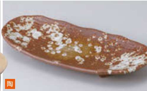
127-202-152 1,200円 備前白四足焼物皿(25×11.5×3.5) 511760315