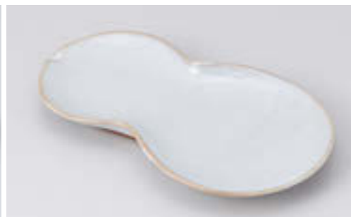
127-502-742 890円 海鼠釉瓢付出皿(21.2×12.7×2.5) 613130274