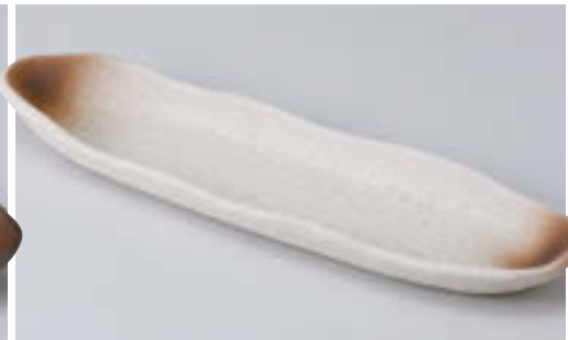
127-303-522 950円 白伊賀吹付出皿(27.8×7.8×2.5) 511840152