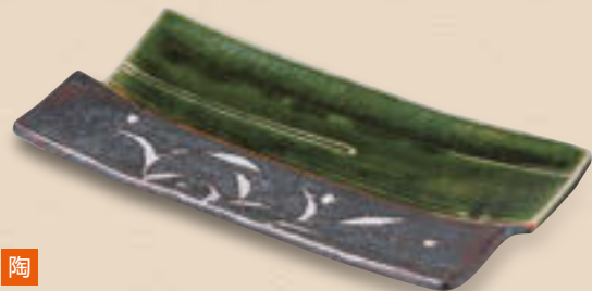
陶 120-102-052 4,300円 掛け分け足付長角皿 (24.5×12.5×2.8) 810920105