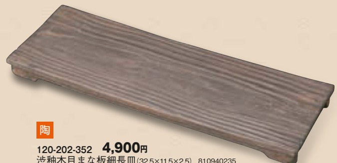
陶 120-202-352 4,900円 渋釉木目まな板細長皿 (32.5×11.5×2.5) 810940235