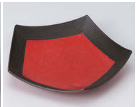
117-303-332 2,800円 渋黒レッド五角大皿(24×23.5×4.5) 911320433