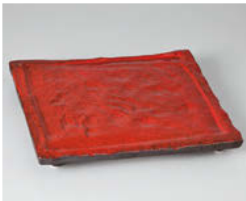
117-301-302 3,000円 紅黒炭正角皿小(20.5×20.3×2.5) 709020230