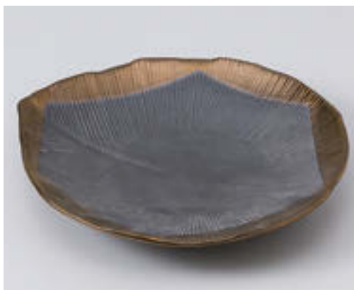
117-401-332 2,700円 いぶし金彩盛皿(25.3×22.8×4) 1111240233