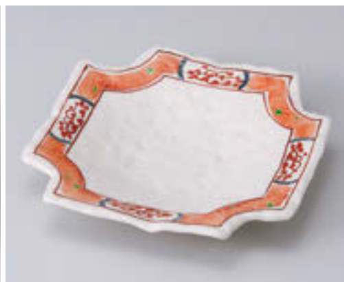
117-402-052 2,750円 赤絵隅切皿(18×18×3) 510740305