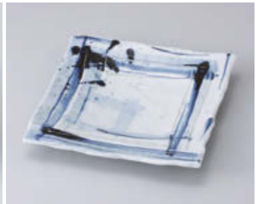
117-203-342 3,050円 呉須格子散らし6.5皿(20×20×3) 510650334