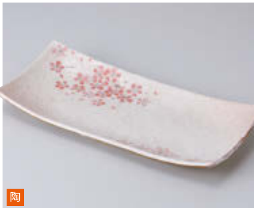
陶 117-201-522 3,280円 平安桜長焼皿(29.8×13×3.5) 514040252