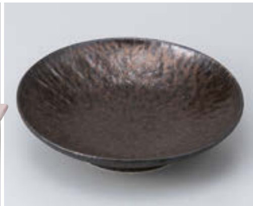
117-202-052 3,150円 金結晶とちり8.0深皿(24×5.5) 810440105