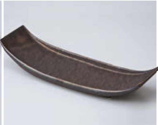
117-103-342 3,300円 金結晶舟型32cm皿(30×10.4×5.7) 611230134