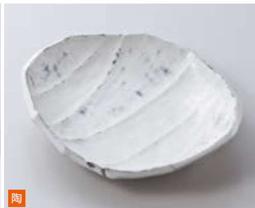
陶 117-302-612 3,300円 粉引彫22cm浅皿(22.6×19×5.6) 610650261