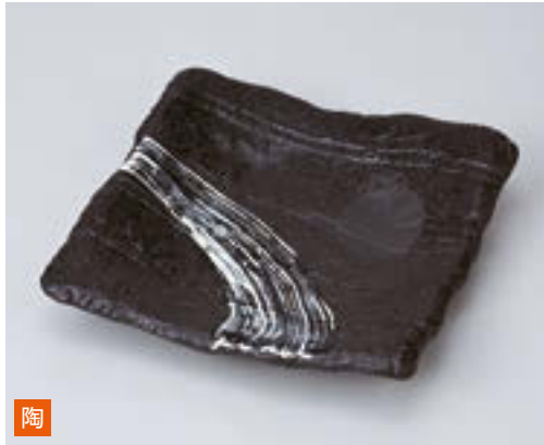
陶 117-101-612 3,600円 銀河四角前菜皿(19×18.5×4) 709710261