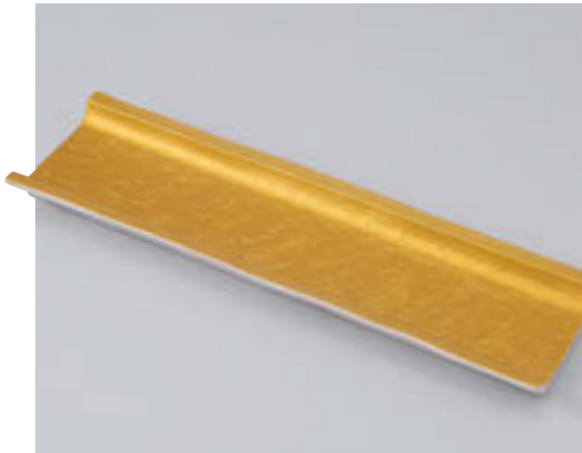
111-201-052 4,200円 石肌両上り11.0皿ゴールド(33.5×10.3×2.5) 1111440105