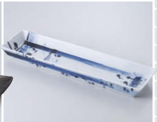
111-303-342 3,650円 呉須格子散し長角12.0鉢(36.7×10.5×3.5) 524920334