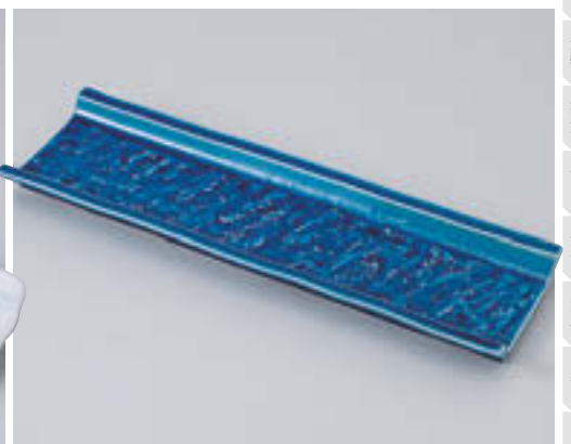
111-403-052 2,900円 石肌両上り11.0皿トルコ(35×10.5×2.5) 1111430105