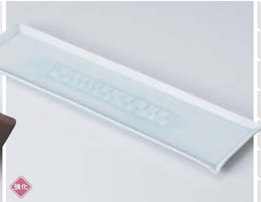
111-102-302 5,250円 炭化土吹15.0長皿(46×12×2.5) 623920230