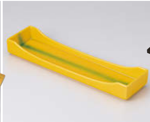
111-202-262 4,280円 黄釉緑彩箱長皿(30.5×8×3.8) 1010730126