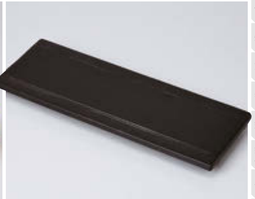
111-203-082 4,250円 黒柚子36cm長皿(36.5×12.2×2.5) 709310308