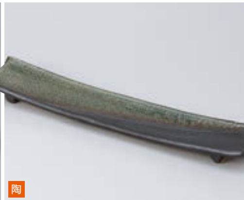
111-301-252 4,100円 強化ラスタ-舟形9寸前菜皿(27×5×3.6) 511010225