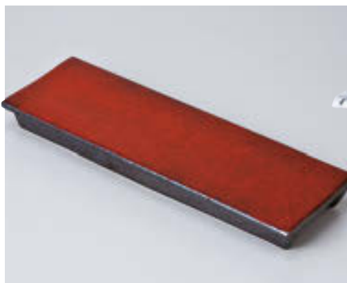
111-401-302 3,400円 紅黒炭 レール(中)(31×10×3.3) 709710130