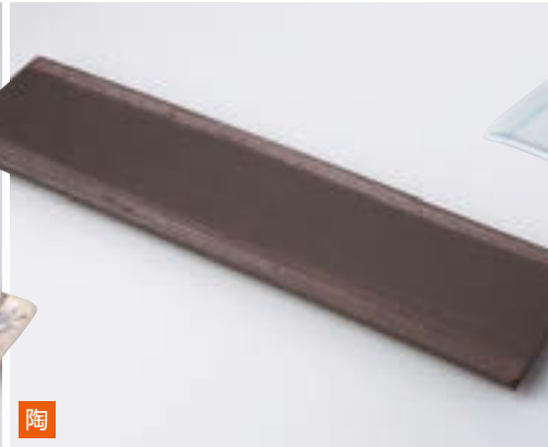
111-101-052 8,000円 手造り 流水春秋付出皿(38×8×2) 1211110105