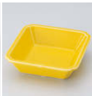
105-402-052 900円 黄釉角鉢 (11.5×11.5×3.5) 516760305