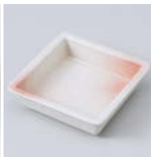
105-405-152 620円 ピンク吹松花堂小鉢 (11.6×11.6×3.2) 1110530415