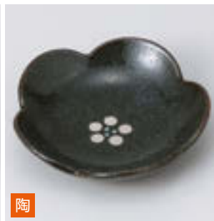
105-302-782 1,030円 黒化粧白梅紋松花堂 (11×3) 817710578