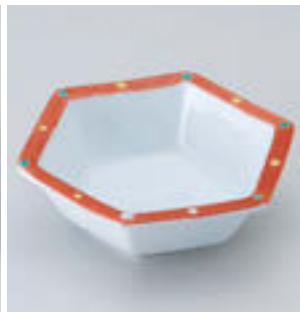
105-105-072 1,300円 朱巻点紋六角鉢 (11.3×10×3.5) 516950407