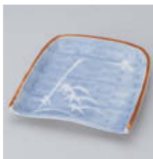
105-504-052 630円 竹籠型皿 (11×11) 516750405