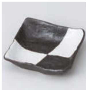
105-304-702 890円 市松4.0浅鉢 (11×11×3.2) 817350270