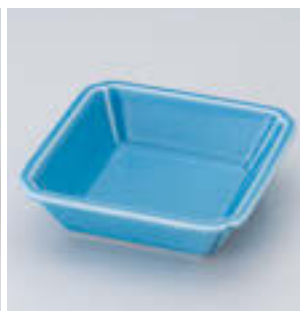
105-403-052 900円 トルコ釉角鉢 (11.5×11.5×3.5) 516760405