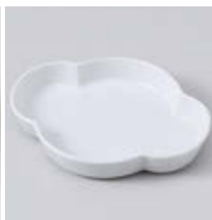
105-502-262 800円 白磁 雲形皿 (13×10.2×2.1) 1110460426