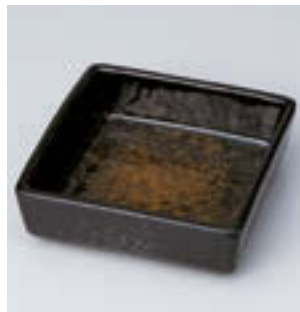
105-101-782 1,430円 京黒黄彩4.0切立鉢 (11×11×3.8) 817310378