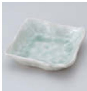
105-305-742 720円 白化粧角鉢 (10.8×10.8×2.7) 516940574