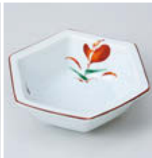
105-103-472 1,300円 花ひらり六角鉢 (10×10×3.5) 716960347