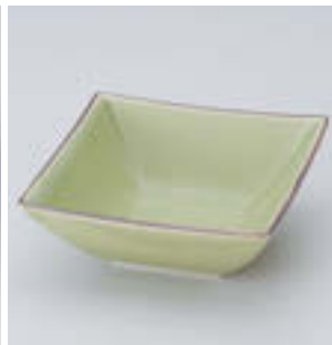
105-102-342 1,300円 測鑄ヒワ京型角小鉢 (11.2×11.2×4.3) 516930234