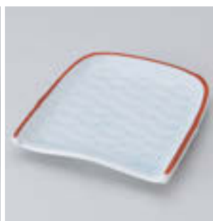
105-505-052 630円 測赤青地ザル型皿 (11×11) 516750305