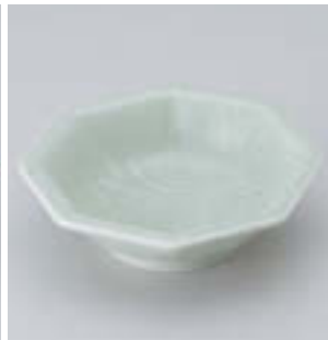
105-203-052 1,150円 ヒワ釉八角鉢 (11.2×11.2×3.5) 516960505