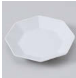
105-205-262 800円 白磁 八角11.5cm皿 (11.3×11.3×2.2) 1110460526