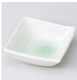
105-404-262 560円 若草(松花堂兼用)角小鉢 (10.5×10.5×3.9) 817520426