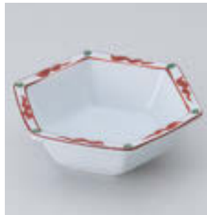
105-201-472 1,400円 赤絵小波六角鉢 (11.2×10×3.5) 516960247