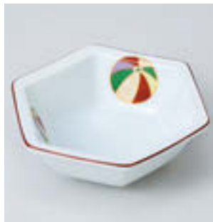
105-104-472 1,300円 夢風船六角鉢 (10×10×3.5) 716960247