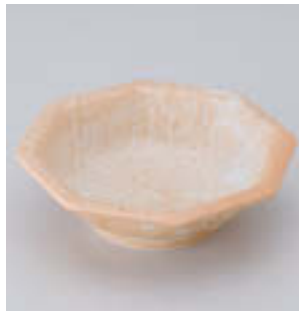
105-204-052 900円 志野八角鉢 (11.2×11.2×3.5) 517060405