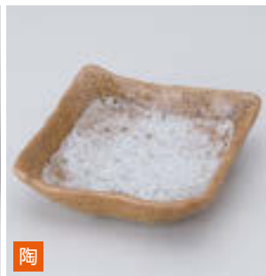
105-303-472 1,050円 うのふ茶唐津角小鉢 (11×11×3) 516940347