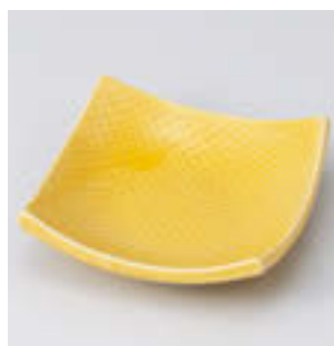
105-501-072 900円 黄 正角 測上り皿 (10.7×3.3) 817530507