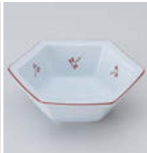
105-202-472 1,100円 トンボ六角鉢 (11.2×10×3.5) 516960447