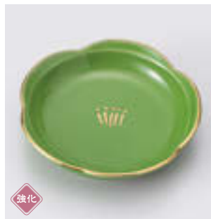
105-301-782 1,300円 測金グリーン梅型皿 (10.5×2.5) 516740377