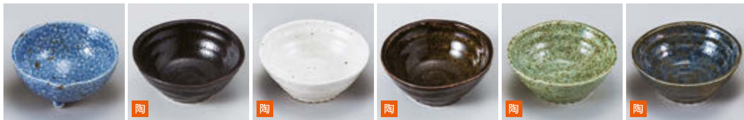
83-601-202 270円 ルリおふけ三ツ足珍味 (8×3.7) 508720420 83-602-792 240円 アミ浜小付 ゆず黒 (9×3.8) 1008960279 83-603-572 240円 アミ浜小付 白 (9×3.8) 508760558 83-604-792 240円 アミ浜小付 オリベ (9×3.8) 1008960679 83-605-572 240円 アミ浜小付 グリーン (9×3.8) 508760658 83-606-572 240円 アミ浜小付 紺 (9×3.8) 508760358

刺身 向付 中鉢 小鉢 小付 珍味 松花堂 前菜皿 付出皿 焼物皿 天皿 香水 蓋物 蒸碗 土瓶蒸し 小皿 和皿 多用皿 多用鉢 盛込鉢 盛込皿 酒器 フリー カップ そば用品 薬味皿 めん皿 井 多用井 波佐見焼 特選 茶漬碗 飯碗 土瓶 ポット 急須 湯呑 千茶 カスター 卓上小物 箸置 レンジ スプーン 灰皿