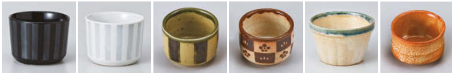
83-201-242 280円 十草切立珍味鉢 黒 (6.7×5) 608520524 83-202-242 280円 十草切立珍味鉢 白 (6.7×5) 608520624 83-203-242 310円 太十草珍味小鉢 (6.6×5) 508660124 83-204-242 310円 格子梅珍味小鉢 (6.6×5) 508650624 83-205-162 370円 南京小付 (8×5) 707410316 83-206-162 360円 赤志野抹茶小付 (7.3×4.9) 508640216