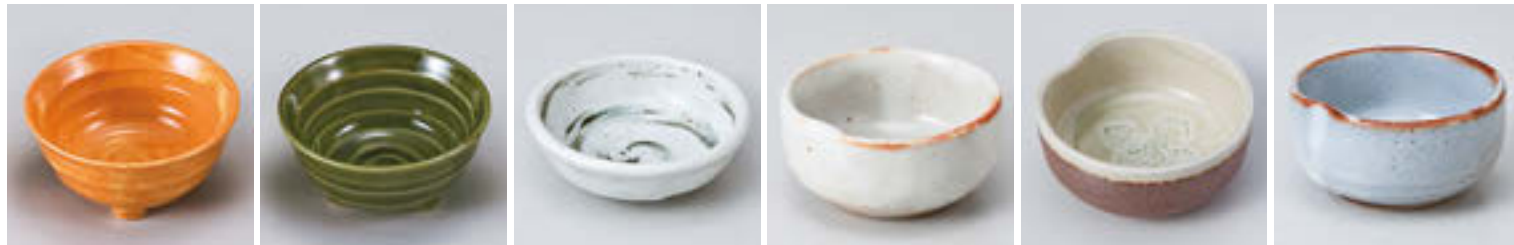
83-301-162 360円 赤志野三ツ足小付 (8.2×4) 508720216 83-302-162 360円 オリベ三ツ足小付 (8.2×4) 508720316 83-303-252 360円 ねずみ滴丸小付 (8.5×2.8) 707520125 83-304-522 300円 白志野一押珍味 (7.5×3.8) 608410352 83-305-262 300円 1押かぶら小付 (7.9×3.5) 807810526 83-306-522 300円 ねずみ志野一押小付 (7.5×3.8) 707410552