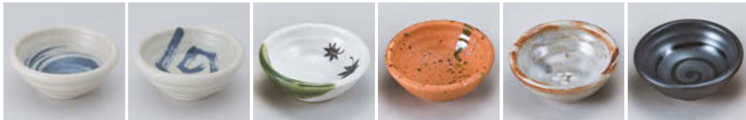
83-501-152 380円 呉須刷毛目六兵衛小付 (8.5×3.5) 508560415 83-502-152 380円 呉須渦巻六兵衛小付 (8.5×3.5) 508560515 83-503-242 310円 紅葉豆鉢 (8.6×3.5) 508660624 83-504-202 280円 織部吹豆鉢 (8.5×3.5) 508710320 83-505-202 280円 嵐志野豆鉢 (8.5×3.5) 508710120 83-506-202 280円 黒うず豆鉢 (8.5×3.5) 508710220