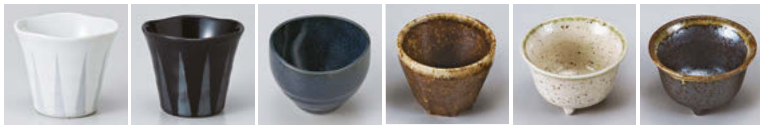
83-101-242 300円 花型剣先珍味鉢 白 (7.3×6.5) 608510224 83-102-242 300円 花型剣先珍味鉢 黒 (7.3×6.5) 608510124 83-103-162 360円 なまこ測波小付 (φ7.2×6) 1208310316 83-104-162 360円 七角茶マダラ小付 (7.2×5.5) 508750316 83-105-162 360円 グリーン梨地小付 (7.8×4.8) 508740116 83-106-162 360円 茶イブシ小付 (7.8×4.8) 508740216