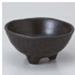
79-606-572 250円 三つ足小付(黒) (9×4.5) 608550458

刺身 向付 中鉢 小鉢 小付 珍味 松花堂 前菜皿 付出皿 焼物皿 天皿 呑水 蓋物 蒸碗 土瓶蒸し 小皿 和皿 多用皿 多用鉢 盛込鉢 盛込皿 酒器 フリー カップ そば用品 薬味皿 めん皿 井 多用井 波佐見焼 特選 茶漬碗 飯碗 土瓶 ポット 急須 湯呑 千茶 カスター 卓上小物 箸置 レンゲ スプーン 灰皿