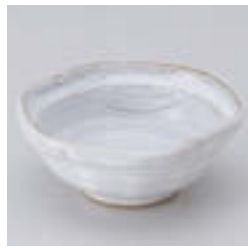
79-206-742 620円 白樺六角小付 (9×9.3×3.7) 508150374