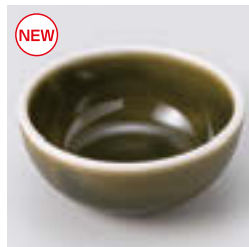
79-401-252 370円 オリーブ 測透明釉8.5cmボール (8.7×3.8) 1207940125