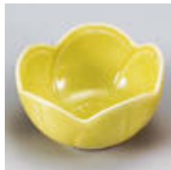
79-501-792 310円 黄梅小鉢 (7.7×4) 508630377