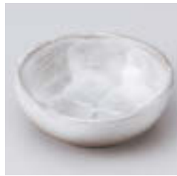
79-301-792 520円 ウノフネリ込3.0丸鉢 (9×3) 542700273