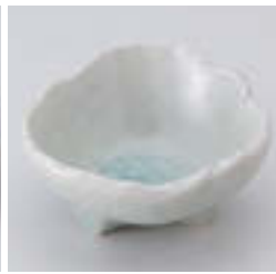
79-202-512 700円 灰貫入三ツ足小付 (7.5×4) 508220151