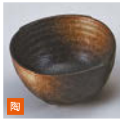
79-305-352 520円 信楽天目花車珍味 (9.3×9×4.7) 508750135