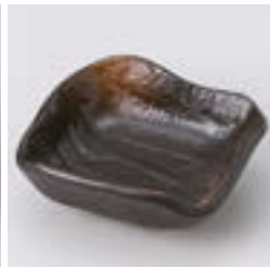
79-302-262 440円 黒備前四つ足8cm変形角鉢 (8.2×7.4×3.4) 1207930226