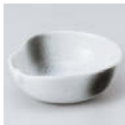
79-101-352 1,050円 白黒吹ひさご型鉢 (9.5×8.6×3.4) 908560535