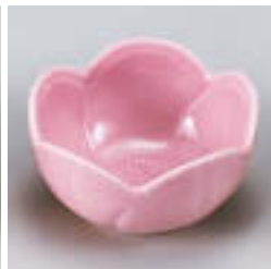
79-502-792 310円 ピンク梅小鉢 (7.7×4) 508630477