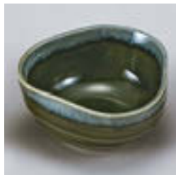
79-504-162 380円 オリベ三角小付 (8×4) 508740516