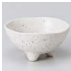
79-605-572 250円 三つ足小付(志野) (9×4.5) 608550358