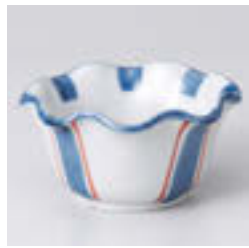
79-207-792 550円 内外2色十草波型小鉢 (9×4.5) 908330279