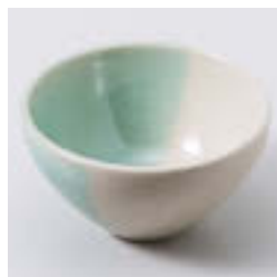
79-106-782 700円 ブルー塗分け モダンボールSS (φ8.2×4.3) 1107820578