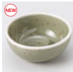
79-406-252 370円 マシコ 測透明釉8.5cmボール (8.7×3.8) 1207940625