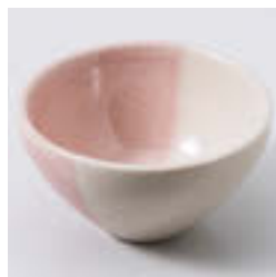
79-105-782 700円 ピンク塗分け モダンボールSS (φ8.2×4.3) 1107820678