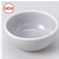
79-402-252 370円 アイスグレー 測透明釉8.5cmボール (8.7×3.8) 1207940225