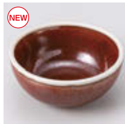
79-405-252 370円 鉄赤 測透明釉8.5cmボール (8.7×3.8) 1207940525