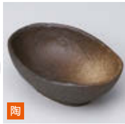
79-304-572 430円 うでい楕円小付 (8.2×11.5×4) 807630557