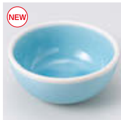
79-404-252 370円 スカイ 測透明釉8.5cmボール (8.7×3.8) 1207940425