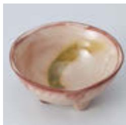
79-604-572 250円 志野オリベ流3ッ足小付 (9×4.5) 508760157