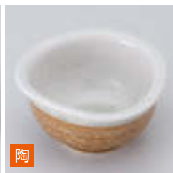
79-102-472 980円 ビードロ3.0三角小鉢 (9.2×9×4.7) 508010547