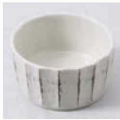
79-205-312 630円 風車しのぎ小付 (7.5×4) 1107930531