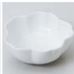
79-103-032 900円 桜雲 白 小鉢 (9.5×4) 908130503