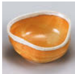
79-505-162 380円 赤伊賀三角小付 (8×4) 508740416