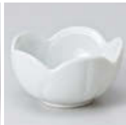
79-503-792 310円 白梅小鉢 (7.7×4) 608420179