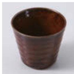
79-601-162 370円 ミニカップ アメ (6.8×5.8) 1107960116