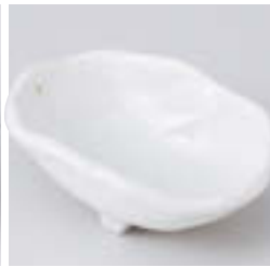
79-303-162 490円 白均窯三足舟型鉢 小 (10×6.8×3.8) 544405316