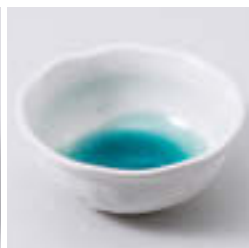
79-602-792 350円 白流水丸鉢 (9.8×4.3) 1107940379