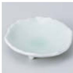
79-104-302 850円 ヒワ青磁ちぎり丸小付 (10×3) 807060430