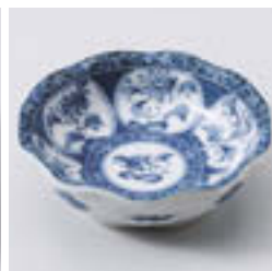
79-603-792 330円 小花唐草3.0寸鉢 (9.5×3.5) 1107960379