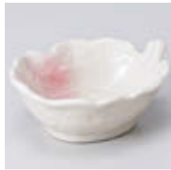
79-306-162 380円 桜吹葉型小付 (10×8×4.2) 608210416