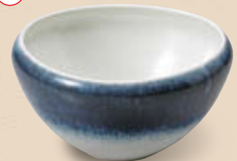
31-303-512 5,250円 アーバンナービー深ボウル(M)(14.5×7.7) 1203130351