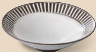
31-203-052 3,400円 白吹反型向付(20.5×6.5) 1003730305