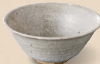
31-401-742 2,520円 真珠ラスタースゲ笠小鉢(15.5×12.3×6.3) 504450374