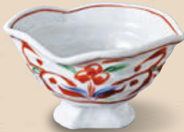
31-201-252 3,200円 赤絵万曆変型高台鉢(14.5×13.5×8) 504330125