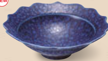
31-102-352 1,900円 Ryoka(稜花)群青14.5cm小鉢(14.7×4.7) 1203110235