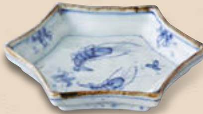
31-202-052 3,300円 吹墨工ヒ絵六角6寸皿(19×15.5×3.3) 1003610105