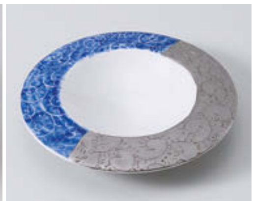
19-403-052 4,500円 プラチナ唐草向付(18.5×3.5) 1002310105