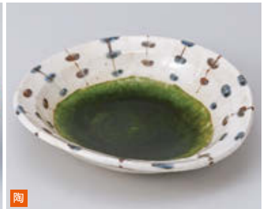
陶 19-203-252 3,900円 手描きすだれ織部楕円深皿(19×18.5×4.3) 801530125