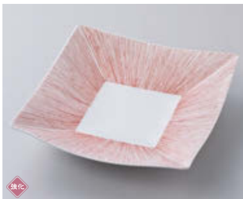
強化 19-401-342 3,800円 千本赤十草正角60深皿(18.5×18.5×5) 602440134