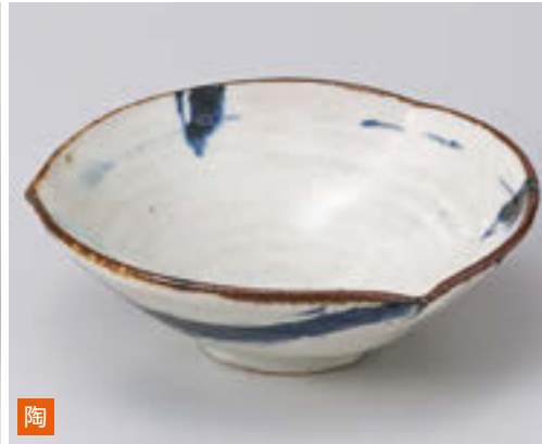
陶 19-102-332 4,000円 安南染描三角平鉢(17×5.7) 801430133