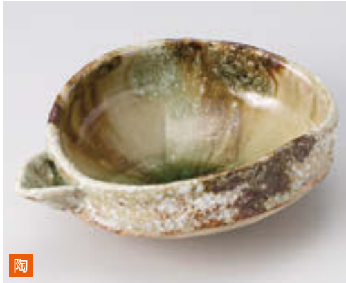
陶 19-101-052 4,000円 灰釉流片口向付(16.7×13×6) 503120305