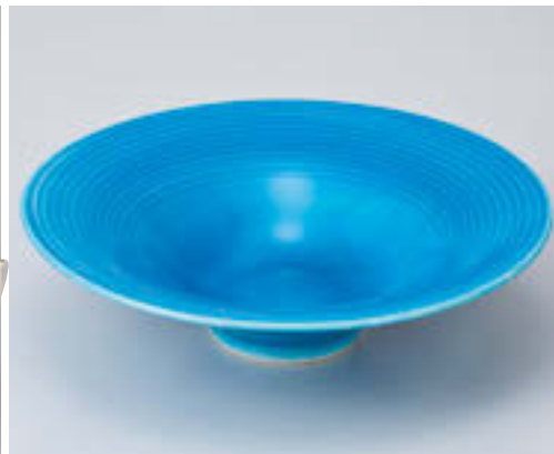
19-202-342 3,950円 トルコ交趾千段浅鉢(16×4.5) 701430234