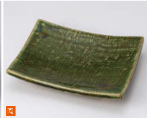
陶 19-103-052 4,000円 手造り 織部カヤメ四つ足長角皿(17.5×14.5×3.3) 1201910305