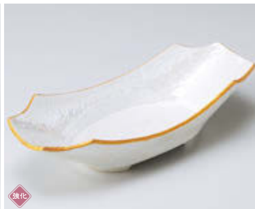
強化 19-302-782 3,920円 ラスター船型向付(23.2×9.6×5.7) 1101750278