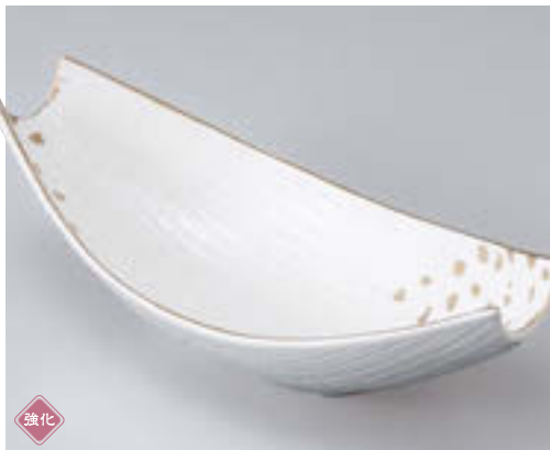
強化 19-201-782 4,020円 金吹雪向付(22.8×10×7) 503040378