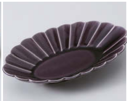
19-303-052 3,800円 アメシストフラワーボール(24.5×13.8×4.2) 1101830105