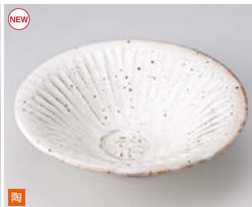
NEW 陶 19-402-072 3,250円 粉引そぎ福反向付(18.5×5.2) 1201940207