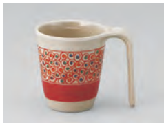
970-渦 [ 渦 ] 容量：200ml 重量：103g 価格：¥1,040 → p 186