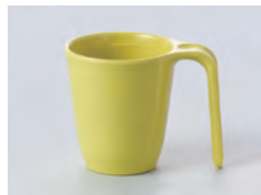
970-きはだ [ きはだ ] 容量：200ml 重量：103g 価格：¥760 → p 186