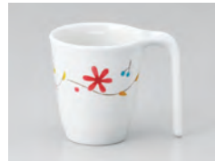
970-HR [ 花かざり ] 容量：200ml 重量：103g 価格：¥1,040 → p 186