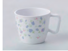
669-マリー [ マリー ] 容量：220ml 重量：94g 価格：¥1,010 → p 190