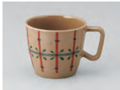
669-かぐや [ かぐや ] 容量：220ml 重量：94g 価格：¥1,010 → p 190