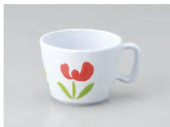
63-TP [ チューリップ ] 容量：200ml 重量：53g 価格：¥870 → p 190