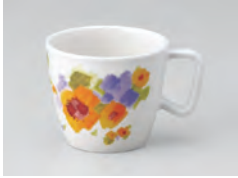
669-HW [ ひまわり ] 容量：220ml 重量：94g 価格：¥1,010 → p 190