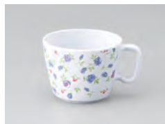
63-マリー [ マリー ] 容量：200ml 重量：53g 価格：¥870 → p 190