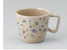
669-野ばら [ 野ばら ] 容量：220ml 重量：94g 価格：¥1,010 → p 190