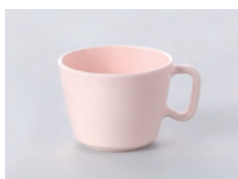
63-ピーチ [ ピーチ ] 容量：200ml 重量：53g 価格：¥750 → p 190