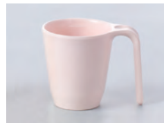
970-さくら [ さくら ] 容量：200ml 重量：103g 価格：¥760 → p 186