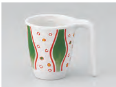
970-小川 [ 小川 ] 容量：200ml 重量：103g 価格：¥1,040 → p 186