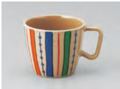
669-色流し [ 色流し ] 容量：220ml 重量：94g 価格：¥1,010 → p 190