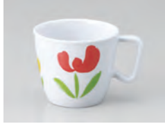
669-TP [ チューリップ ] 容量：220ml 重量：94g 価格：¥1,010 → p 190