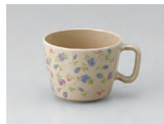
63-野ばら [ 野ばら ] 容量：200ml 重量：53g 価格：¥870 → p 190