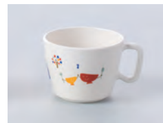
63-PA [ パーティー ] 容量：200ml 重量：53g 価格：¥870 → p 190