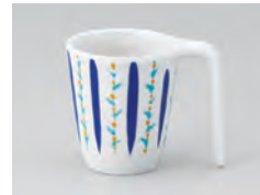
970-やなぎ縞 [ やなぎ縞 ] 容量：200ml 重量：103g 価格：¥1,040 → p 186