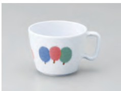
63-KD [ 木立 ] 容量：200ml 重量：53g 価格：¥870 → p 190