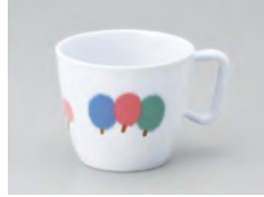
669-KD [ 木立 ] 容量：220ml 重量：94g 価格：¥1,010 → p 190