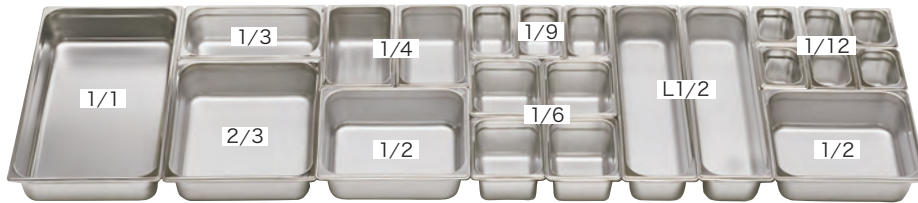
サイズ組み合わせ例