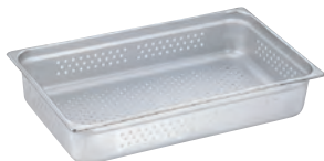
18-8 ガストロノーム 穴明パン