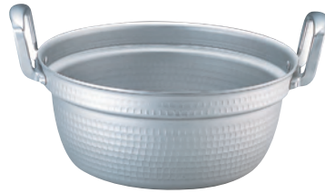
TKG アルミ円付鍋 (アルマイト加工)