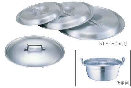
アカオ アルミ料理鍋蓋 (落とし込みタイプ)