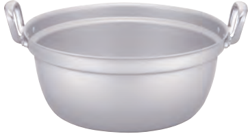
TKG IH アルミ 円付鍋