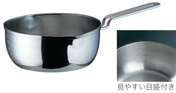
見やすい目盛付き