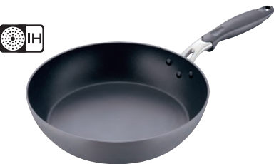
ロック＆ロック 鍛造硬質アルマイト IH フライパン