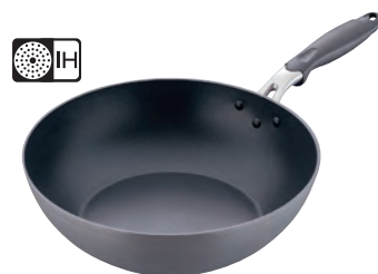
ロック＆ロック 鍛造硬質アルマイト IH いため鍋