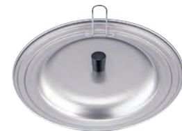
アルミ JC フライパンカバー