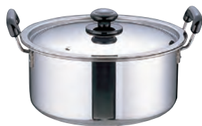
ステンレス ブラ柄 厚板実用鍋 (モリブデン含有ステンレス鋼)