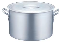
TKG アルミニウム半寸胴鍋 目盛付 (アルマイト加工)