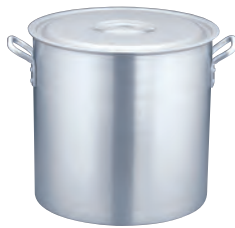
TKG アルミニウム寸胴鍋 目盛付 (アルマイト加工)