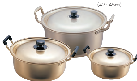
アカオしゅう酸 実用鍋 (硬質)

板厚：1.0mm ・耐孔食性・耐酸性はSUS304以上 (18-0ステンレス鋼モリブデン入り・チタン添加) ・電磁調理器に使用出来ます。 ※商品損失のおそれがあるため、空焚きは絶対にしないでください。