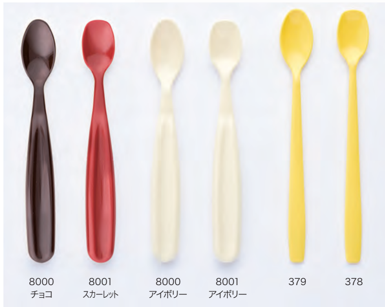
8000 チョコ 8001 スカーレット 8000 アイボリー 8001 アイボリー 379 378