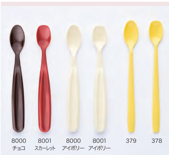
8000 チョコ 8001 スカーレット 8000 アイボリー 8001 アイボリー 379 378