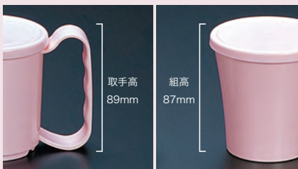
4本指の取手 スリムタイプ

7 150ml 451 組高 87mm 387 素材:ポリプロピレン ライフコップ スリム スリム用 蓋 φ80×110×H84 240ml ¥ 600 85×8 ¥ 250 ※取手高89mm