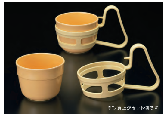
※写真上がセット例です

7 180ml 253-レモン 370-レモン ライフコップ レモン コップホルダー レモン 92×69 300ml ¥ 600 φ93×155×H93 ¥ 930 素材:メラミン 素材:ポリプロピレン