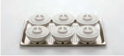
1/1 ホテルパン (530×330×20mm)