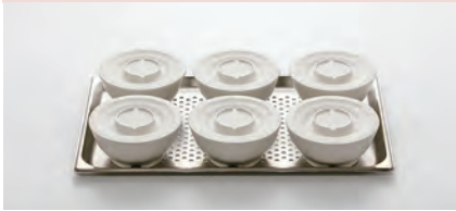
1/1 ホテルパン (530×330×20mm)