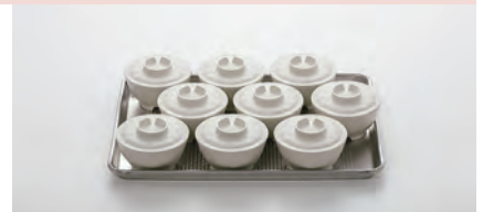
シートパンハーフ (456×328×25mm)