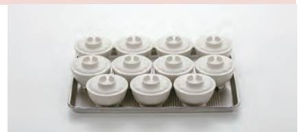
シートパンハーフ (456×328×25mm)