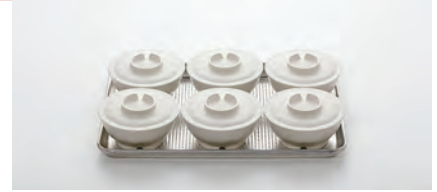
シートパンハーフ (456×328×25mm)