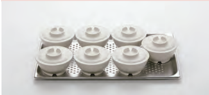
1/1 ホテルパン (530×330×20mm)