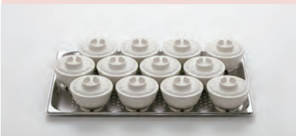
1/1 ホテルパン (530×330×20mm)