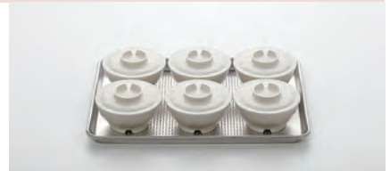
シートパンハーフ (456×328×25mm)