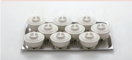
1/1 ホテルパン (530×330×20mm)