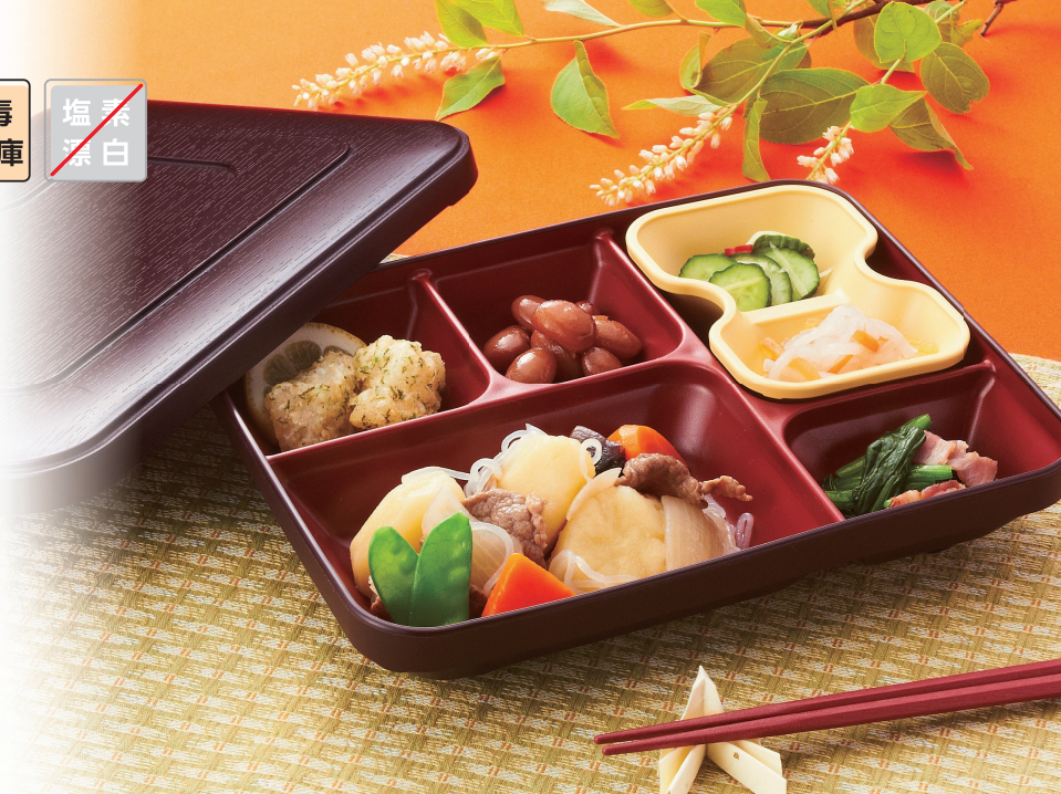
使用食器 | P-322 T・P-321 TUS・P-3211 Y 弁当箱、TH-210SN R PBT箸

●溜 (T) ●ベージュ (V) ●溜内朱 (TUS) ●イエロー (Y) ●ピンク (P)