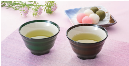
使用食器 | PC-84 (NGR・NBR)湯呑、YS-291 YIR 菊型平皿