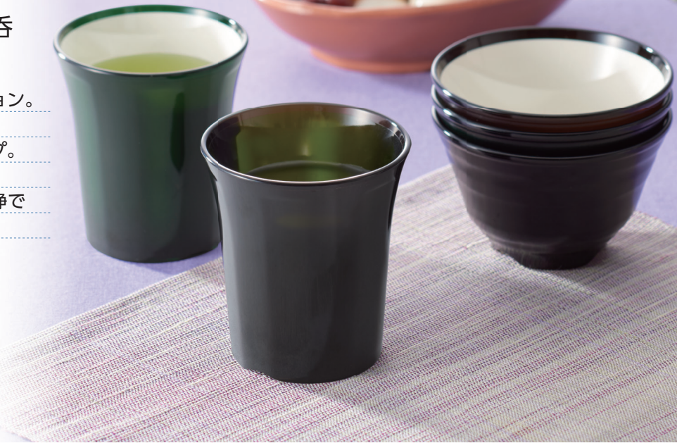
使用食器 | PC-83 (NGR・SBR)湯呑、PC-84 (NBR・NGR・SBR) 湯呑、T-502 ORB 小判皿