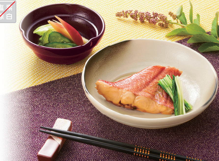
使用食器 | T-501 UZU 深皿、T-503 AME 小鉢、TH-220X KUK PBT塗り箸