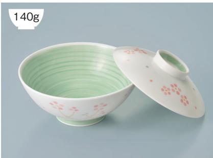
140g KF-829 RIO(里桜) 飯碗蓋 115 × 27 (10/80) ¥930