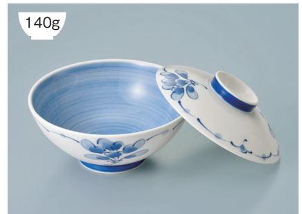
140g KF-829 SEI(青風) 飯碗蓋 115 × 27 (10/80) ¥930