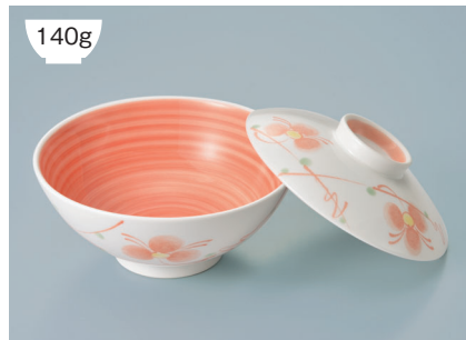
140g KF-829 HH(初花) 飯碗蓋 115 × 27 (10/80) ¥930