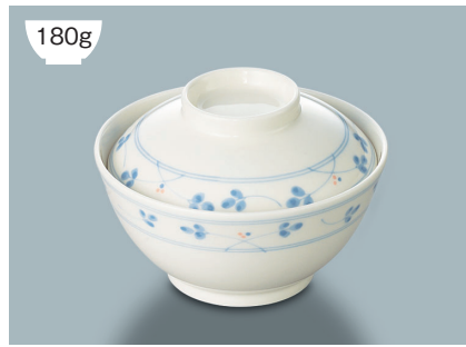
180g YF-160 HG(萩) 飯碗蓋 111 × 33 (5/80) ¥940