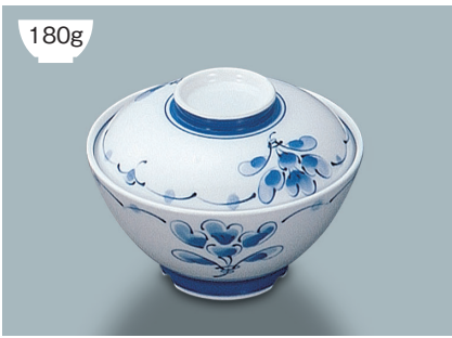
180g KF-436 SEI(青風) 飯碗蓋 116 × 34 (10/100) ¥960