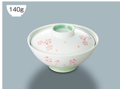
140g KF-829 RIO(里桜) 飯碗蓋 115 × 27 (10/80) ¥930