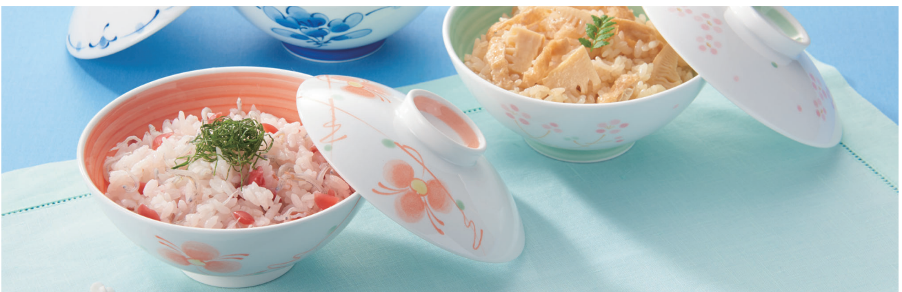
使用食器 | KF-829 HH・KB-828 HHO 飯碗、KF-829 RIO・KB-828 RIOG 飯碗