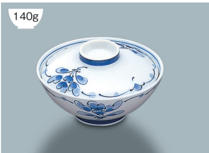
140g KF-829 SEI(青風) 飯碗蓋 115 × 27 (10/80) ¥930