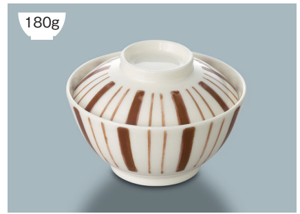
180g YF-160 TTI(十草茶) 飯碗蓋 111 × 33 (5/80) ¥990