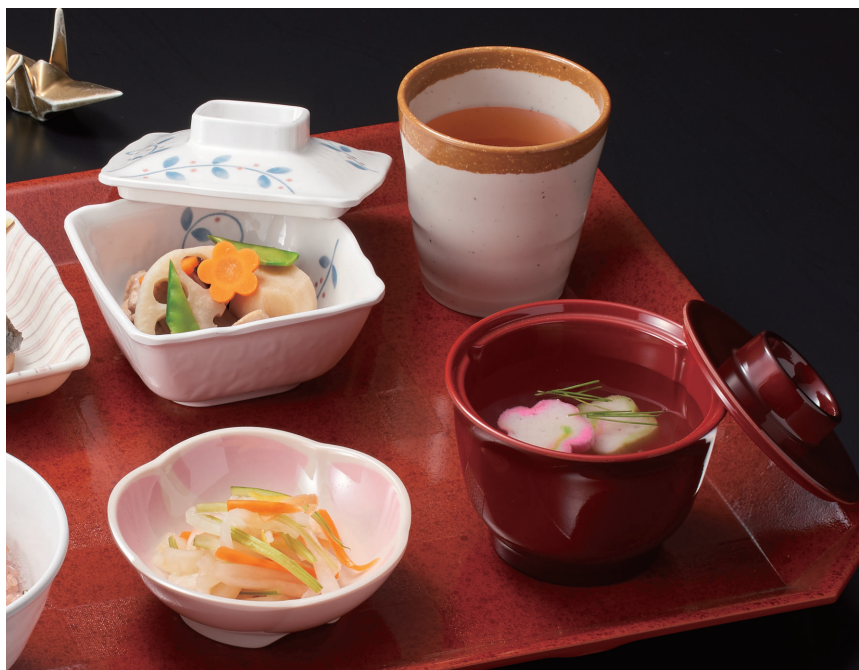
使用食器 | MB-917 NTK ・ MB-916 NTK 角小鉢、MC-88 WAB 湯呑、MB-769 UME 梅小鉢、 MB-7 TUS ・ MB-6 TUS 汁椀