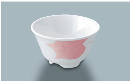
MC-13 HNE (葉音) 湯呑 AB 97 × 55 ・ 200ml ¥690