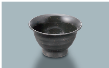
MC-86 KMT (黒マット) 湯呑 95 × 56 ・ 170ml ¥500