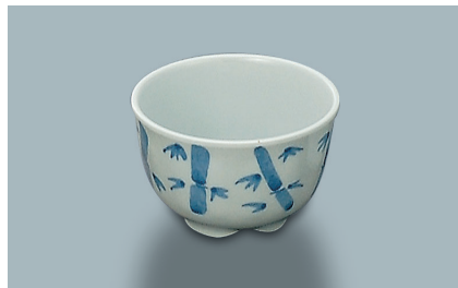
MC-14 F (ふる里) 湯呑 86 × 55 ・ 190ml ¥640