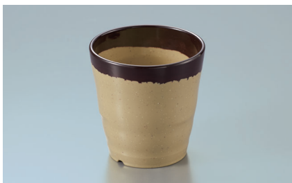
MC-88 SAB (さび) 湯呑 77 × 78 ・ 220ml ¥1,040 P-204 ¥350 → P.290 PPF-507 ¥330 → P.294