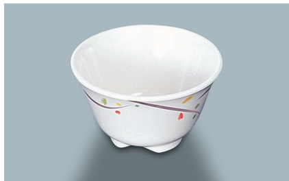
MC-13 LNA (ルナデコール) 湯呑 AB 97 × 55 ・ 200ml ¥620