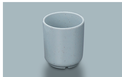
MC-832 FA (ふる里) 切立湯呑 68 × 77 ・ 190ml ¥520 PP-474E ¥270 → P.294