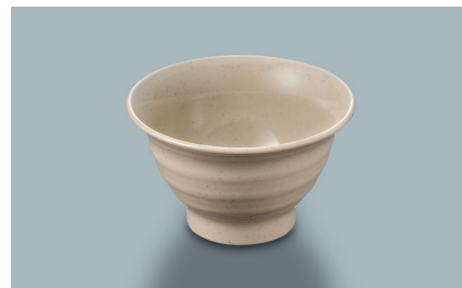
MC-86 SX (砂石焼) 湯呑 95 × 56 ・ 170ml ¥500