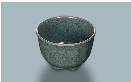
MC-14 WT (技) 湯呑 86 × 55 ・ 190ml ¥460