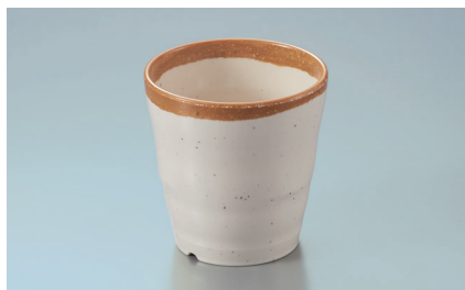
MC-88 WAB (わび) 湯呑 77 × 78 ・ 220ml ¥1,040 P-204 ¥350 → P.290 PPF-507 ¥330 → P.294