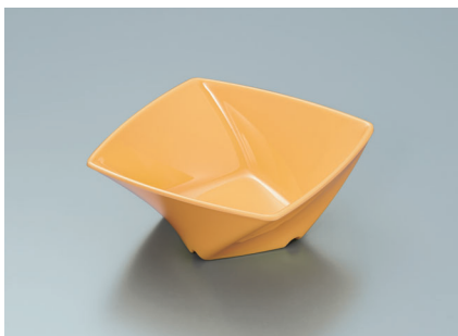
MB-680 MO (メロンオレンジ) ツイストボール A 110 × 110 × 45 ・ 230ml ¥800 C-1111 ¥350 → P.292