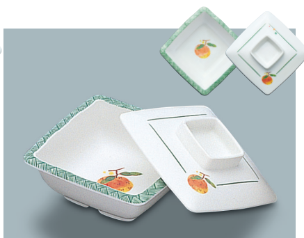
MB-339 F (ふる里) 角小鉢蓋 104 × 104 × 27 ¥880 MB-338 F (ふる里) 角小鉢 A 110 × 110 × 40 ①64 ・ 220ml ¥1,050