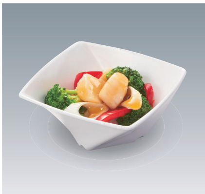
使用食器 | MB-680 W ツイストボール