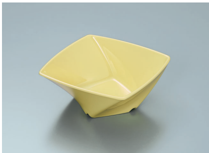
MB-680 LMY (ライムイエロー) ツイストボール A 110 × 110 × 45 ・ 230ml ¥800 C-1111 ¥350 → P.292