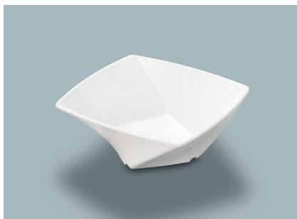
MB-680 W (ホワイト) ツイストボール A 110 × 110 × 45 ・ 230ml ¥800 C-1111 ¥350 → P.292