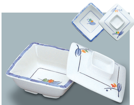
MB-339 NAM (夏目) 角小鉢蓋 104 × 104 × 27 ¥880 MB-338 NAM (夏目) 角小鉢 A 110 × 110 × 40 ①64 ・ 220ml ¥1,050