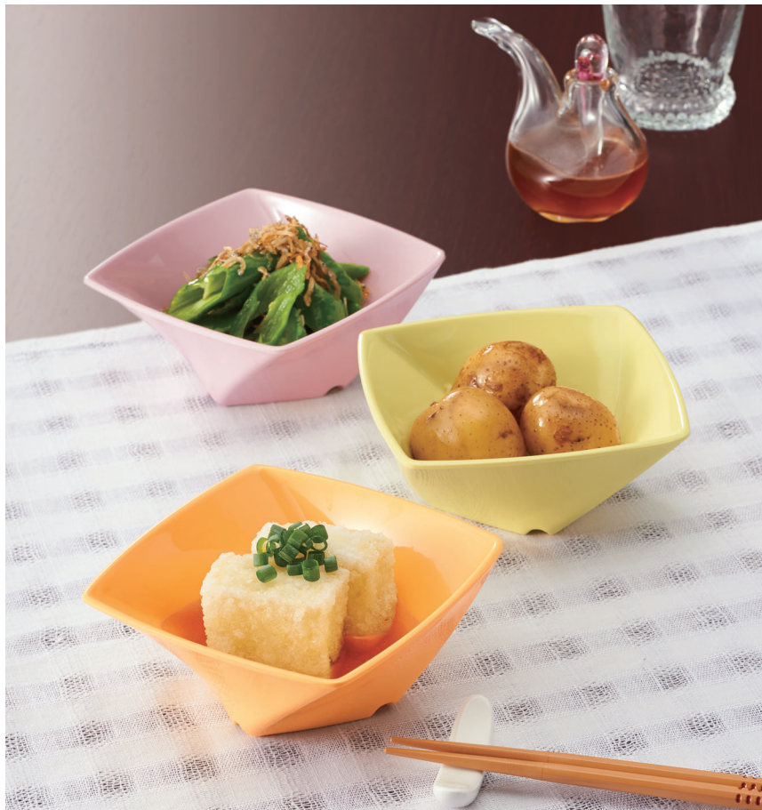
使用食器 | MB-680 (MO・LMY・SAK) ツイストボール