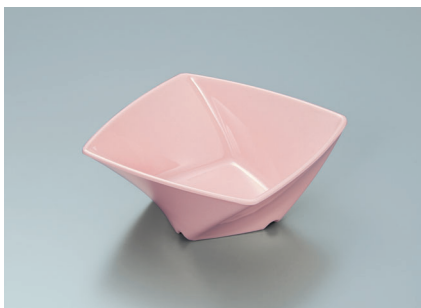
MB-680 SAK (桜) ツイストボール A 110 × 110 × 45 ・ 230ml ¥800 C-1111 ¥350 → P.292