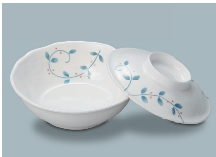
MB-965 NTK (南天唐草) 煮物椀蓋