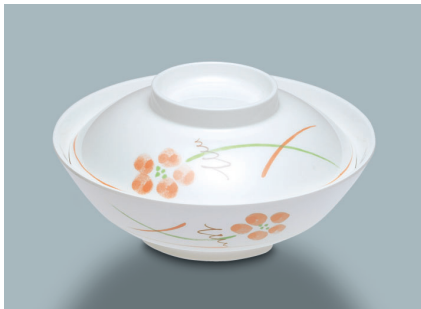
MB-604 YUK (友花) 煮物椀蓋