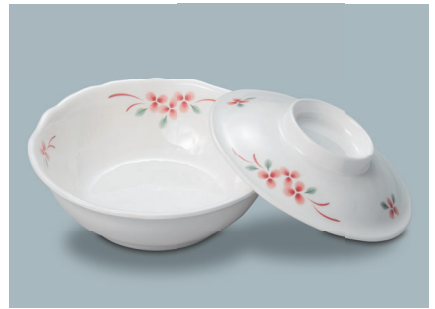
MB-965 AEK (赤絵小花) 煮物椀蓋