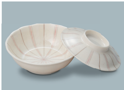
MB-965 TKU (十草) 煮物椀蓋