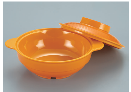
MB-85 RO (ルーージュオレンジ) スープボール蓋