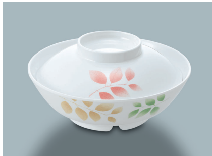
MB-604 HNE (葉音) 煮物椀蓋