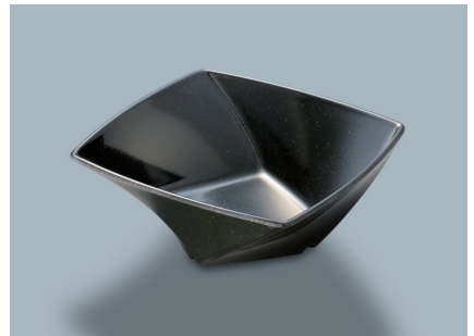
MB-682 KMT (黒マット) ツイストボール AB