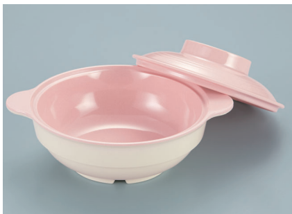
MB-85 SAK (桜) スープボール蓋

POINT ①一つひとつの風合いが異なる陶磁器の軸をかけたようなグラデーションです。②スープボールですが、煮物椀としても活躍します。