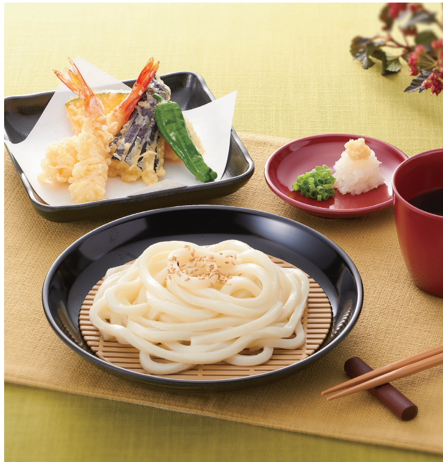
使用食器 | MS-665 BK 菜皿、P-15 V すのこ、MS-872 KMT 角皿、MS-648 R 和皿、MC-735 R つゆ入れ、TH-220X VUK PBT塗り箸