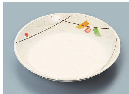
MS-664 SER (セリーン) 菜皿 AB 180 × 30 ¥950 C-180 ¥460 → P.288