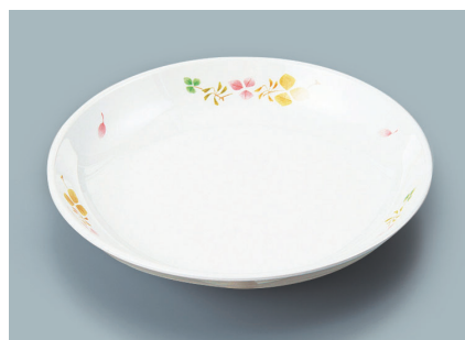
MS-664 HNE (葉音) 菜皿 AB 180 × 30 ¥1,010 C-180 ¥460 → P.288