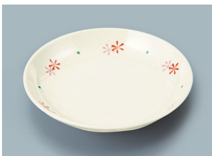
MS-664 HKK (花こころ) 菜皿 AB 180 × 30 ¥1,010 C-180 ¥460 → P.288