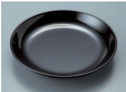
MS-665 BK (黒) 菜皿 AB 190 × 30 ¥840 C-190 ¥470 → P.288