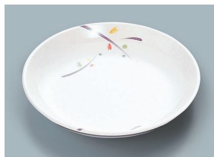
MS-664 LNA (ルナデコール) 菜皿 AB 180 × 30 ¥950 C-180 ¥460 → P.288