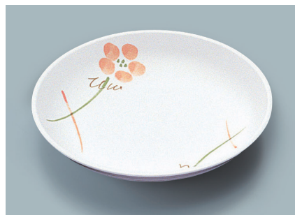
MS-664 YUK (友花) 菜皿 AB 180 × 30 ¥970 C-180 ¥460 → P.288