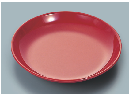
MS-665 R (赤) 菜皿 AB 190 × 30 ¥840 C-190 ¥470 → P.288