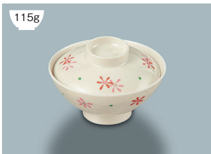
115g MB-804 HKK (花ころも) 飯茶椀蓋 107 × 30 ¥700