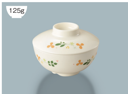
125g MB-233 HMT (花小町) 兼用蓋 112 × 33 ¥920