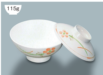
115g MB-804 YUK (友花) 飯茶椀蓋 107 × 30 ¥590