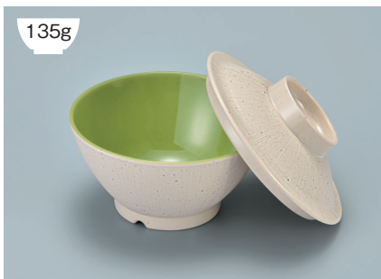
135g MB-905 CS (クリームストーン) ライスボール蓋 121 × 36 ¥630 MB-904 CSUG (クリームストーン内緑) ライスボール(スリム) AB 114 × 59 ① 87・300ml ¥930

POINT ①内側コーティングなので、ご飯がこびりつきにくい飯椀です。 ②ご飯の白さが引き立つカラー。