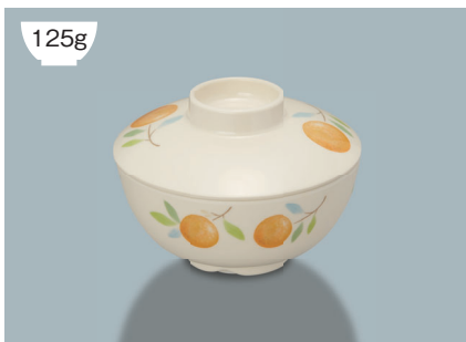
125g 新 MB-233 FEL (フェリーチェ) 兼用蓋 112 × 33 ¥920