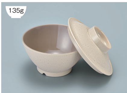
135g MB-905 CS (クリームストーン) ライスボール蓋 121 × 36 ¥630 MB-904 CSUK (クリームストーン内黒) ライスボール(スリム) AB 114 × 59 ① 87・300ml ¥930

POINT ①内側コーティングなので、ご飯がこびりつきにくい飯椀です。 ②ご飯の白さが引き立つカラー。