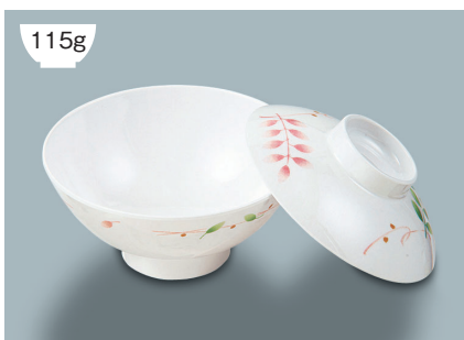
115g MB-804 HNE (葉音) 飯茶椀蓋 107 × 30 ¥700