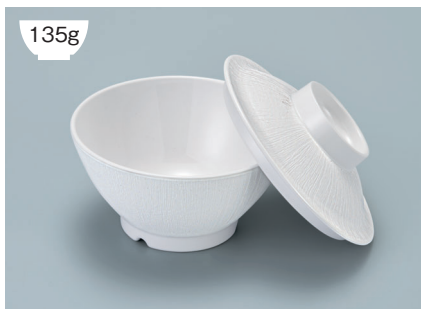
135g MB-905 W (ホワイト) ライスボール蓋 121 × 36 ¥630 MB-904 W (ホワイト) ライスボール(スリム) AB 114 × 59 ① 87・300ml ¥910

POINT ①内側コーティングなので、ご飯がこびりつきにくい飯椀です。 ②ご飯の白さが引き立つカラー。