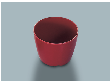
MC-735 R (赤) つゆ入れ 86 × 67・230ml ¥590