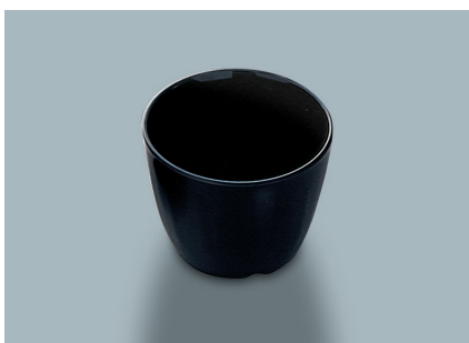
MC-735 BK (黒) つゆ入れ 86 × 67・230ml ¥590