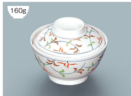
MB-609 F(ふる里)飯椀蓋 111 × 35 ¥670