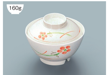
MB-609 YUK(友花)飯椀蓋 111 × 35 ¥640