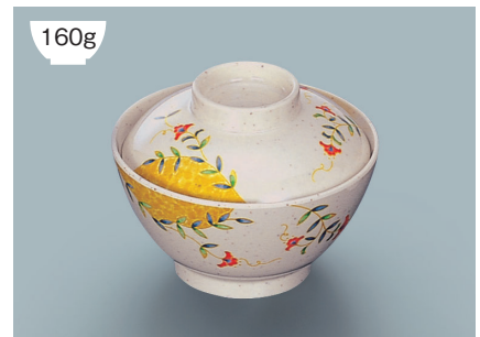
MB-609 FA(ふる里)飯椀蓋 111 × 35 ¥670