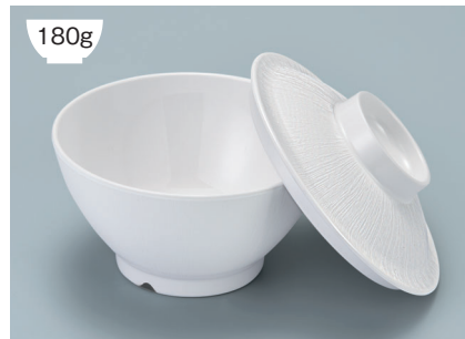
MB-897 W(ホワイト)ライスボール蓋 128 × 36 ¥730

POINT ①内側コーティングなので、ご飯がこびりつきにくい飯椀です。 ②ご飯の白さが引き立つカラー。