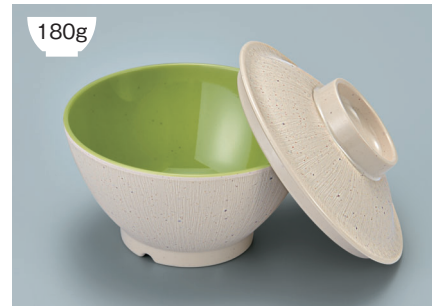
MB-897 CS(クリームストーン)ライスボール蓋 128 × 36 ¥730