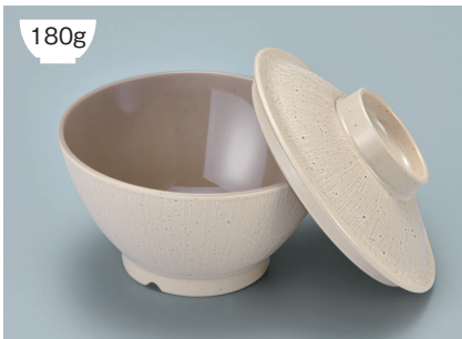
MB-897 CS(クリームストーン)ライスボール蓋 128 × 36 ¥730

POINT ①内側コーティングなので、ご飯がこびりつきにくい飯椀です。 ②ご飯の白さが引き立つカラー。