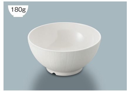
MB-894 W(ホワイト)ライスボール(レギュラー) AB 124 × 61 ・ 400ml ¥1,050