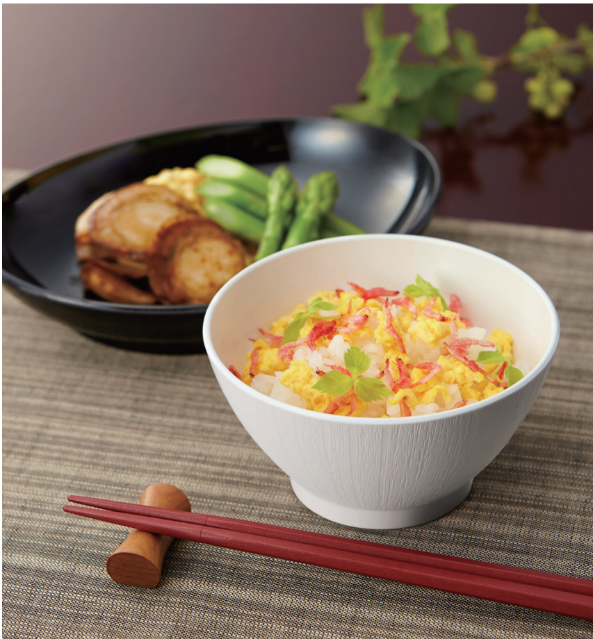
使用食器 | MB-896 W ライスボール(スリム)、MS-848 BK オーバル皿、TH-220S R PBT箸