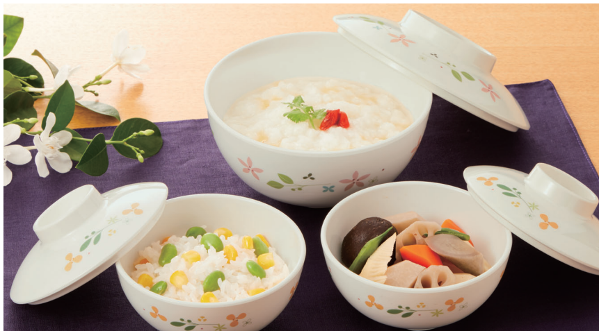
使用食器 | MB-239 HMT・MB-238 HMT 多用椀、MB-233 HMT・MB-230 HMT 多用椀×2