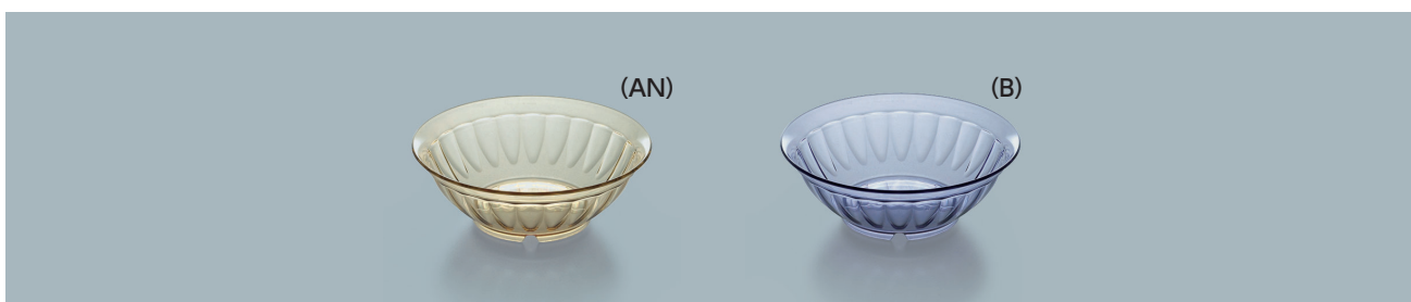
U-5 サラダボール 128 × 44 ・ 290ml ¥1,340 ☉ P-206 ¥410 → P.289