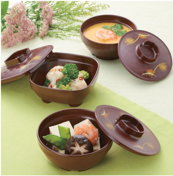
使用食器 | U-35W YSE・U-34 T 小鉢、U-31W YSE・U-30 T 小鉢、 U-41W YSE・U-40 T 角小鉢