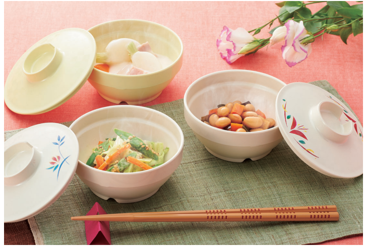
使用食器 | U-31W AOI・U-30 IV 小鉢、U-31W AE・U-30 IV 小鉢、U-31W LMY・U-30 LMY 小鉢、 TH-220X VUS PBT塗り箸